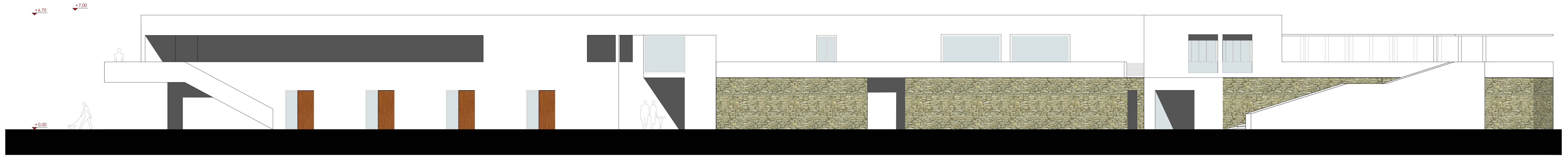
PROSPETTO DEL FRONTE RIVOLTO A NORD