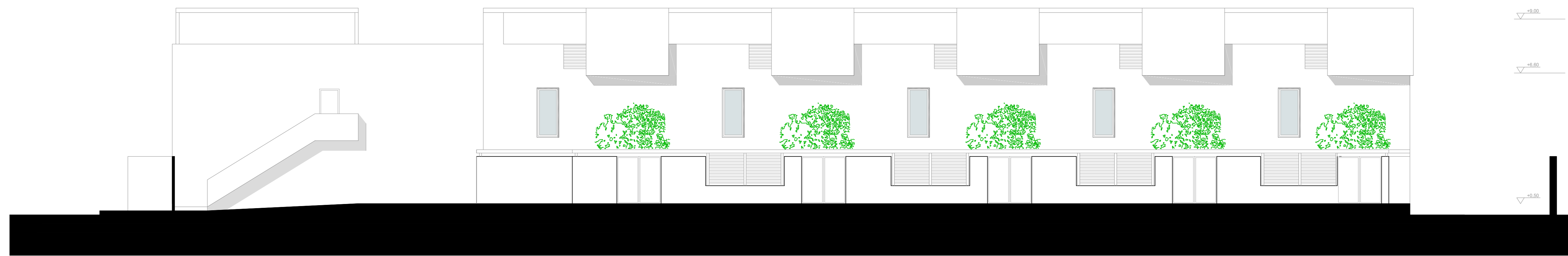
VISTA DEL FRONTE RIVOLTO A MONTE