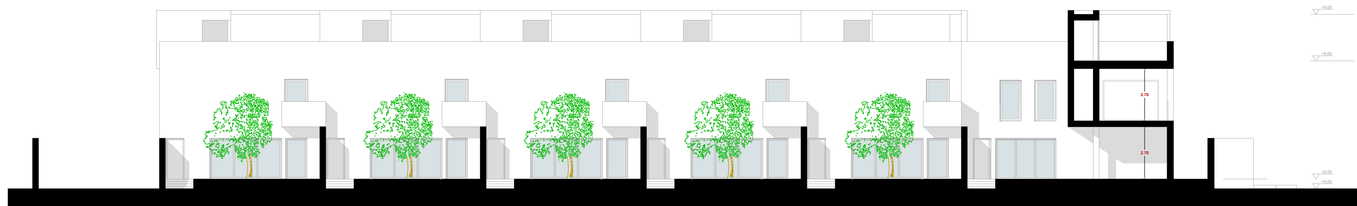
VISTA DEL FRONTE RIVOLTO A MARE