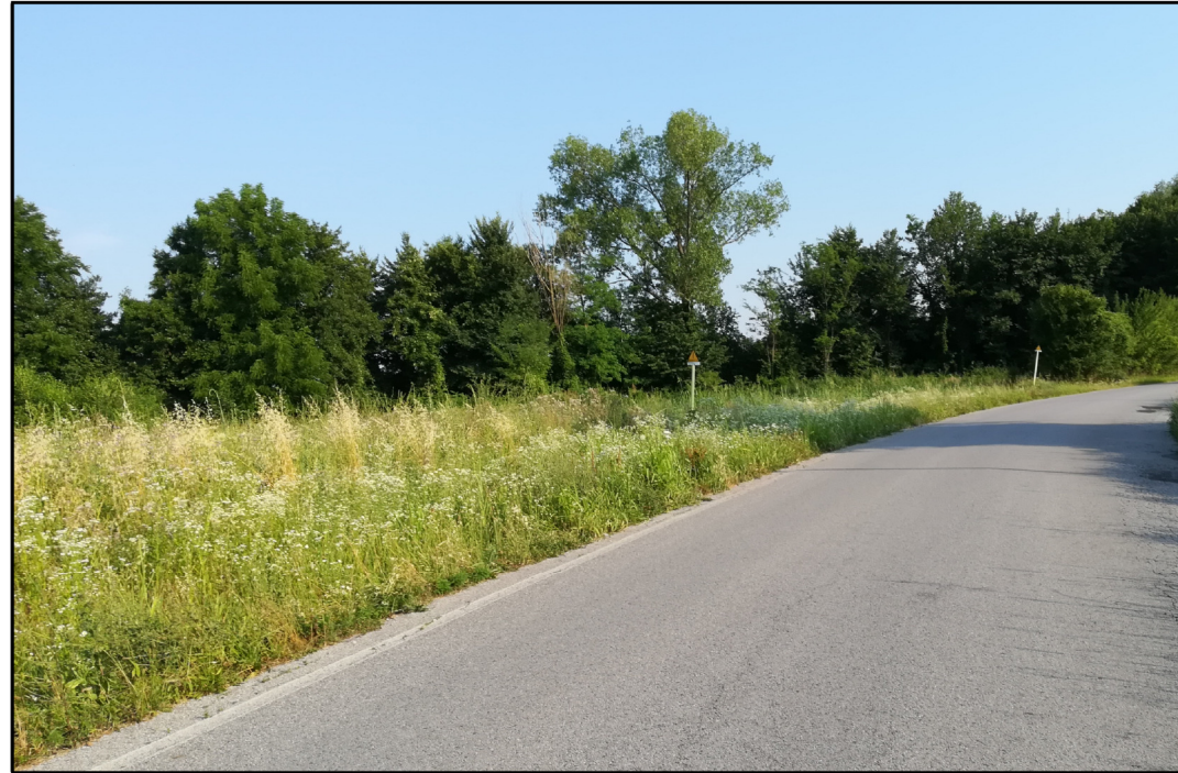
VISTA 1: STATO DI FATTO