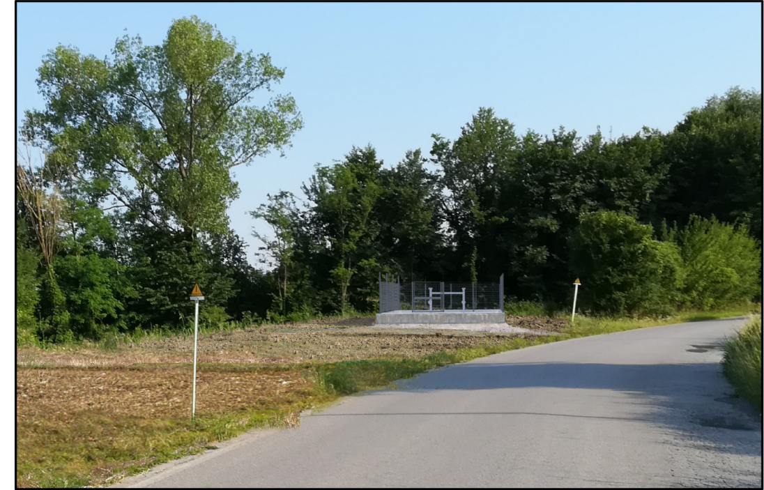
VISTA 2: STATO DI PROGETTO