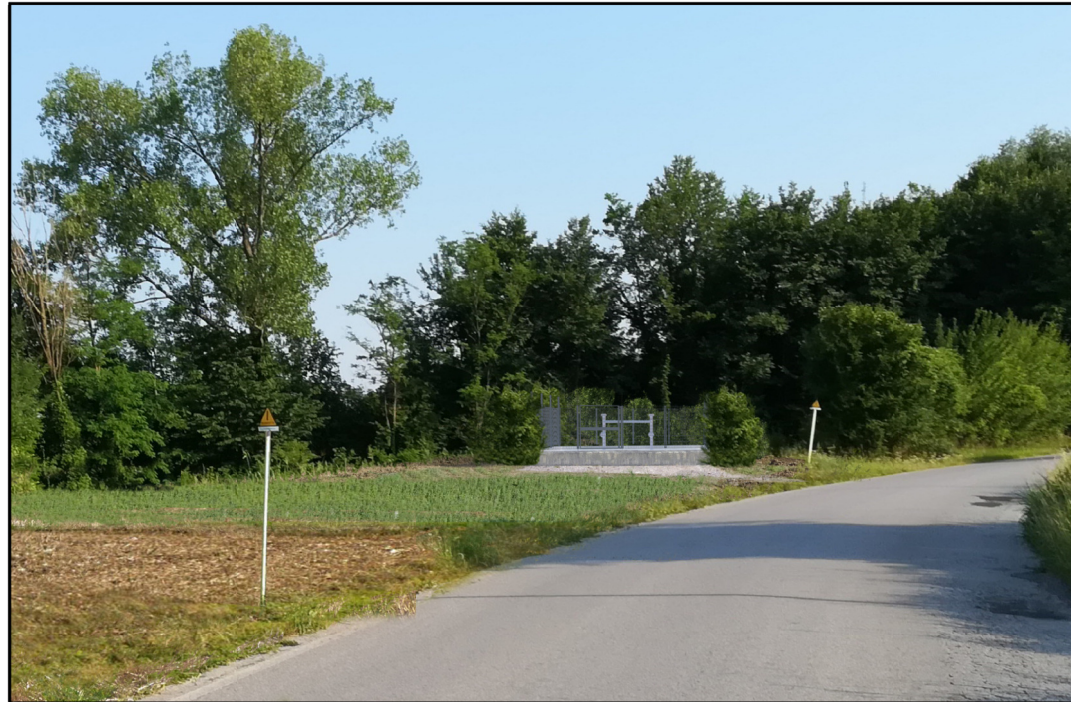
VISTA 3: STATO DI PROGETTO CON MASCHERAMENTO