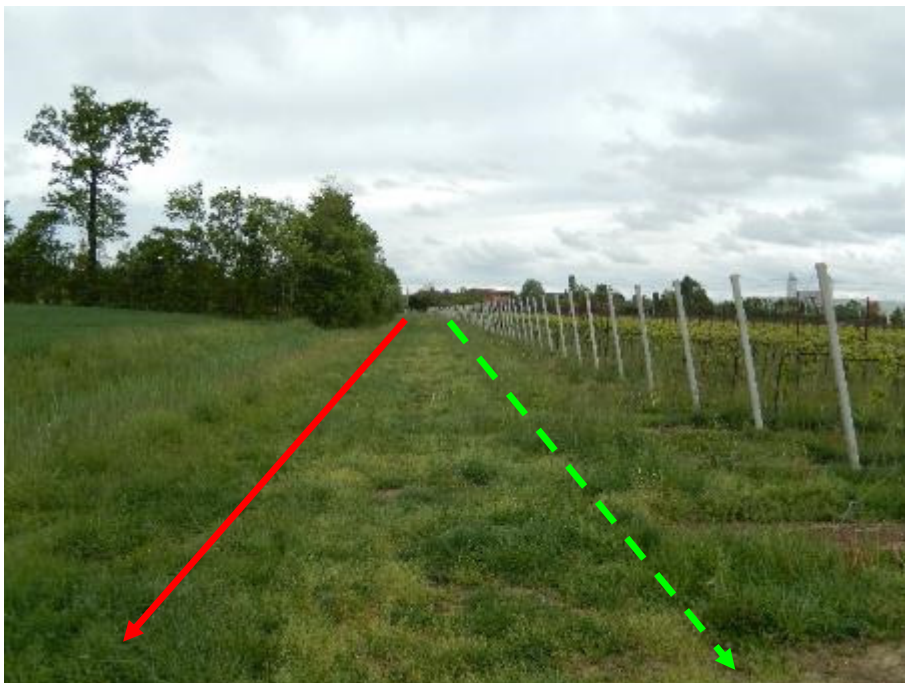
FOTO N.4 - PANORAMICA CONTRO SENSO GAS