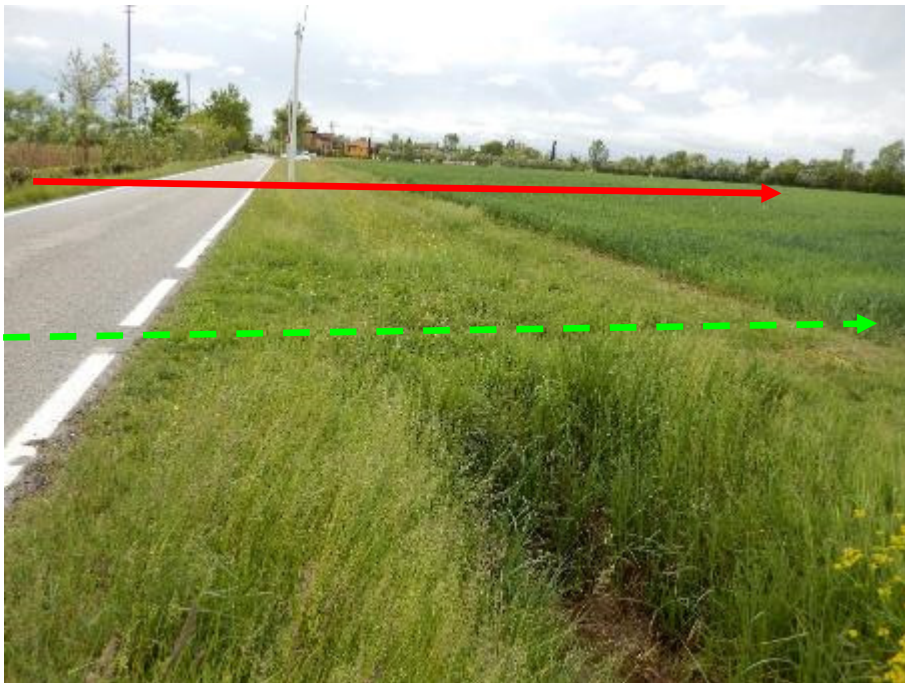
FOTO N.3 - ATTRAVERSAMENTO VIA PESCHIERETTE