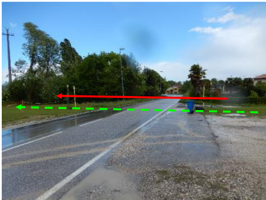
FOTO N.6 - ATTRAVERSAMENTO VIA CAPITELLO