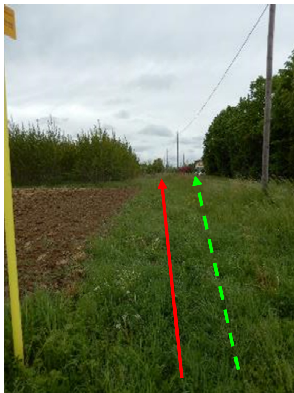
FOTO N.2 - PERCORRENZA IN PARALLELISMO A VIA DE AMICIS