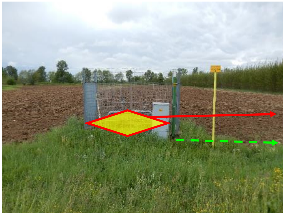
FOTO N.1 - IMPIANTO N.50281 DA DISMETTERE E INSTALLAZIONE NUOVO PIDS