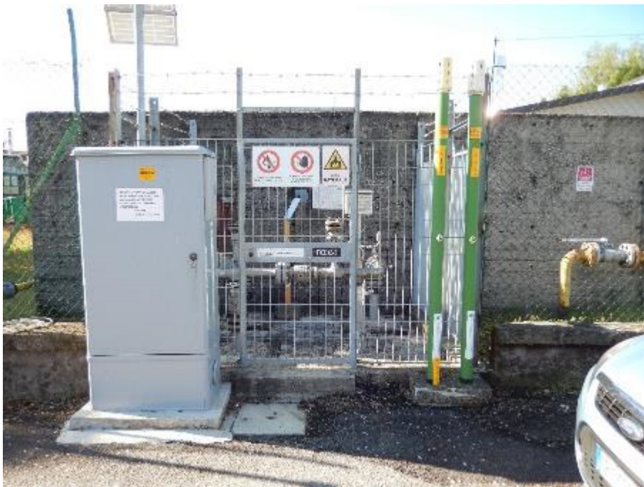
FOTO N.8 - IMPIANTO N.4100972.2 DA DISMETTERE