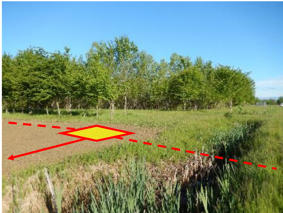
FOTO N.3 - VISTA PANORAMICA IMPIANTI