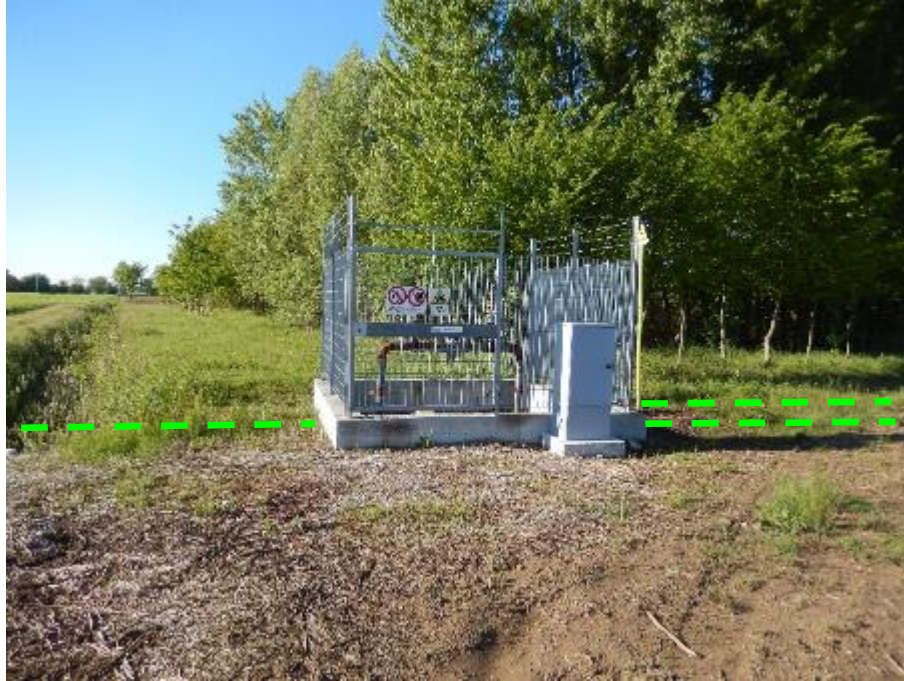
FOTO N.1 - IMPIANTO N. 4100972.1 DA DISMETTERE