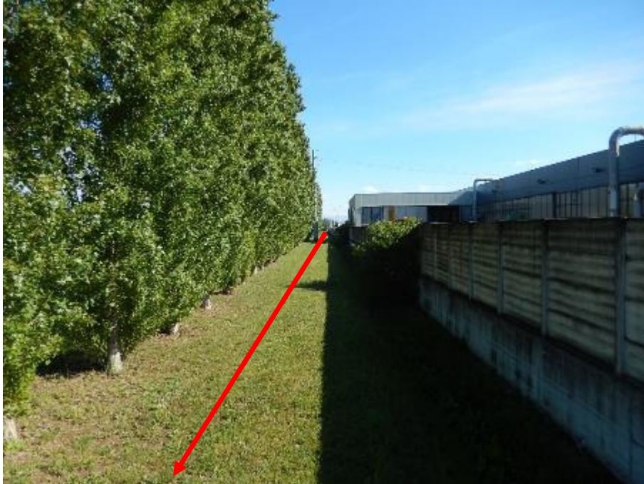
FOTO N.7 - PERCORRENZA DEL METANODOTTO IN PROGETTO AI MARGINI DEL PARCO