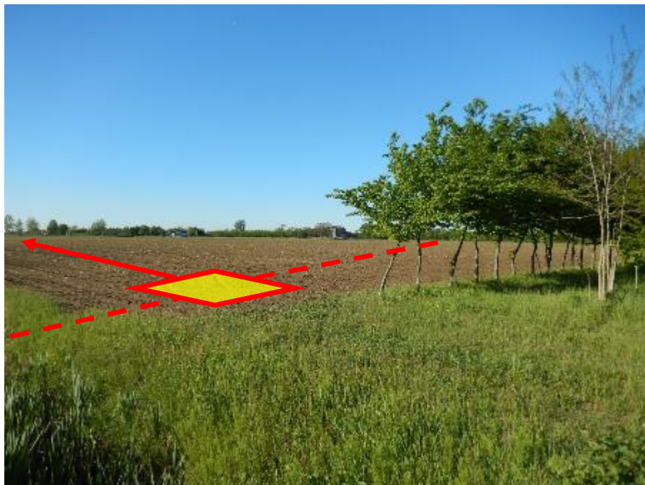
FOTO N.2 - IMPIANTO PIDS 1B IN PROGETTO