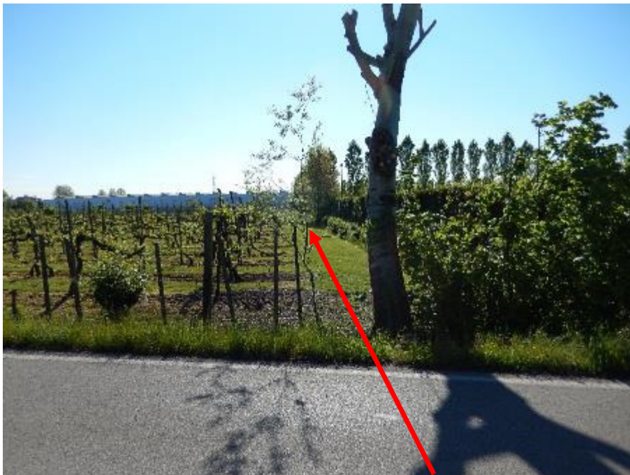
FOTO N.6 - PASSAGGIO ALL'ESTREMITÀ DEL VIGNETO