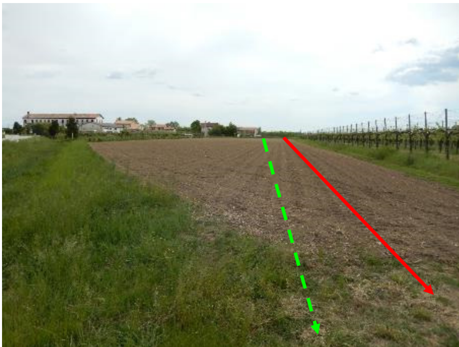
FOTO N.2 - PANORAMICA CONTRO SENSO GAS