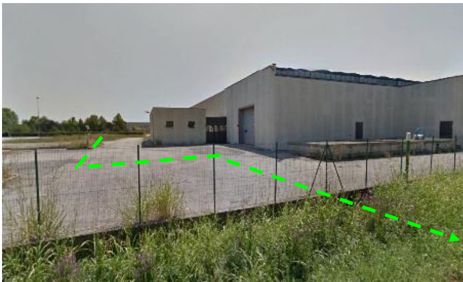
FOTO N.2 -PERCORRENZA IN AREA INDUSTRIALE VISTA CONTRO SENSO GAS