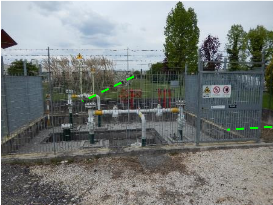
FOTO N.1 - IMPIANTO N.45870.3 DA DISMETTERE