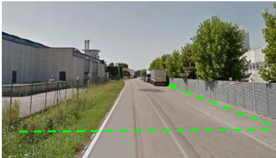
FOTO N.3 - PERCORRENZA IN AREA INDUSTRIALE VISTA SENSO GAS