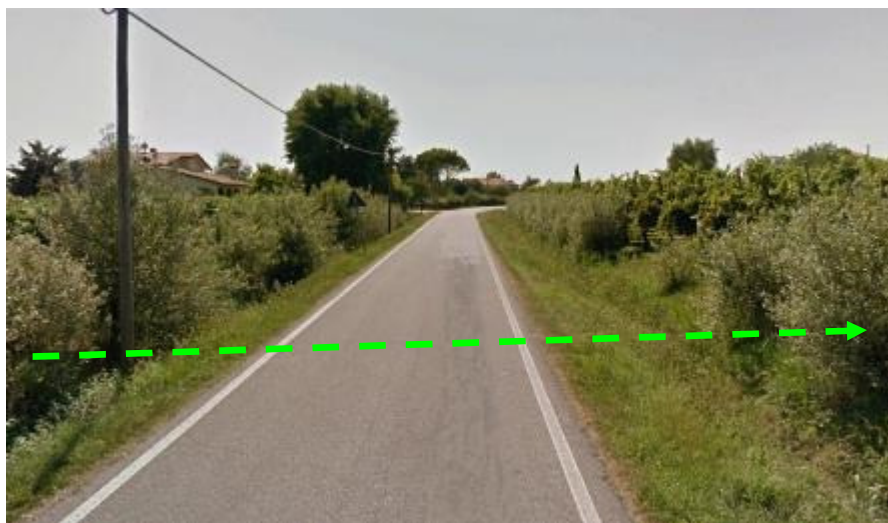
FOTO N.4 - ATTRAVERSAMENTO S.P. N. 133