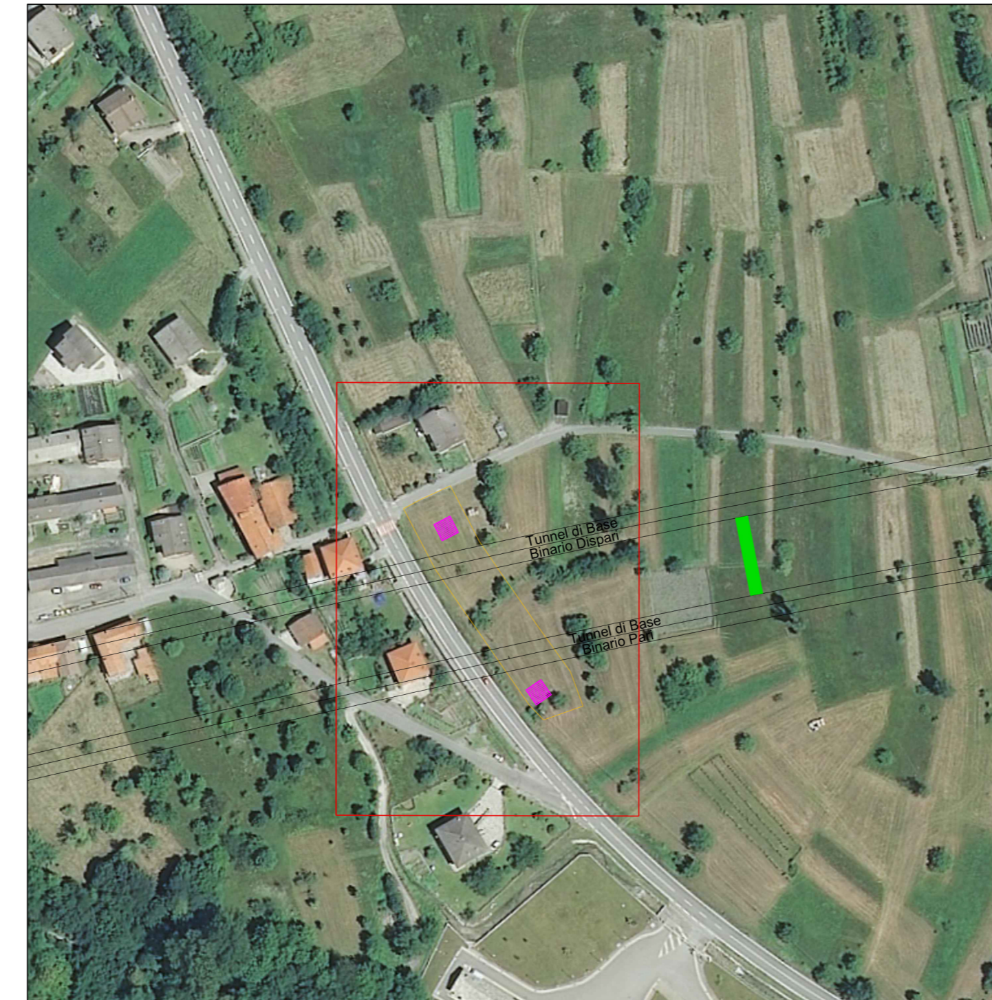
SYSTEME DE REFERENCE LTF 2004c / SISTEMA DI RIFERIMENTO LTF 2004c