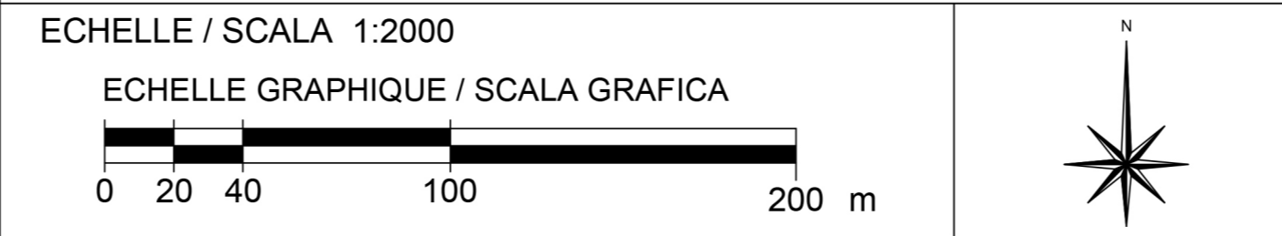
ECHELLE / SCALA 1:2000 ECHELLE GRAPHIQUE / SCALA GRAFICA