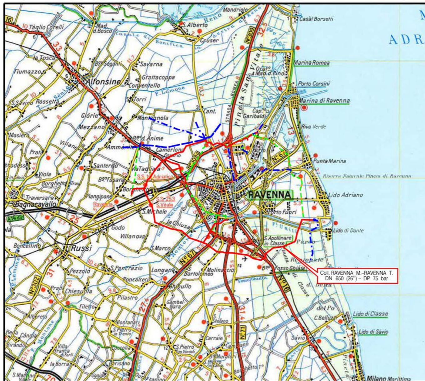
COROGRAFIA Scala 1:200.000

GEA s.r.l. Ricerca e documentazione archeologica Sede Leg.: Via Roma, 48 - 29121 PIACENZA (PC) Ufficio: Str. Farini, 9 - 43121 PARMA (PR) Tel. 0521.237794 - Fax 0521.1852764 Cod. Fisc. e Partita IVA 02045220340 E-mail: geaparma@katamail.com P.E.C.: geaparma@open.legalmail.it