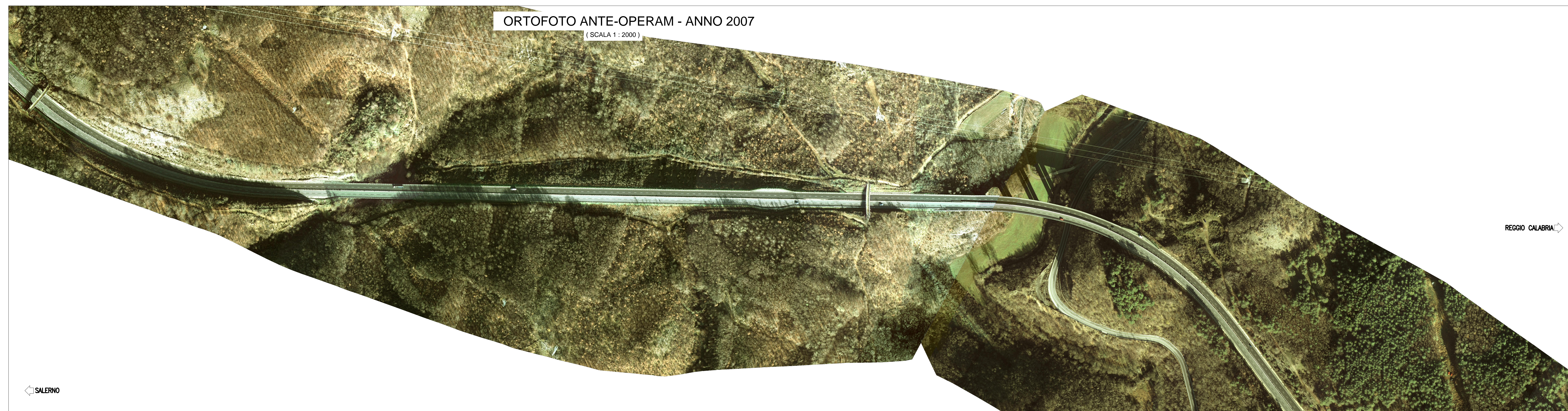
ORTOFOTO ANTE-OPERAM - ANNO 2007 (SCALA 1:2000)