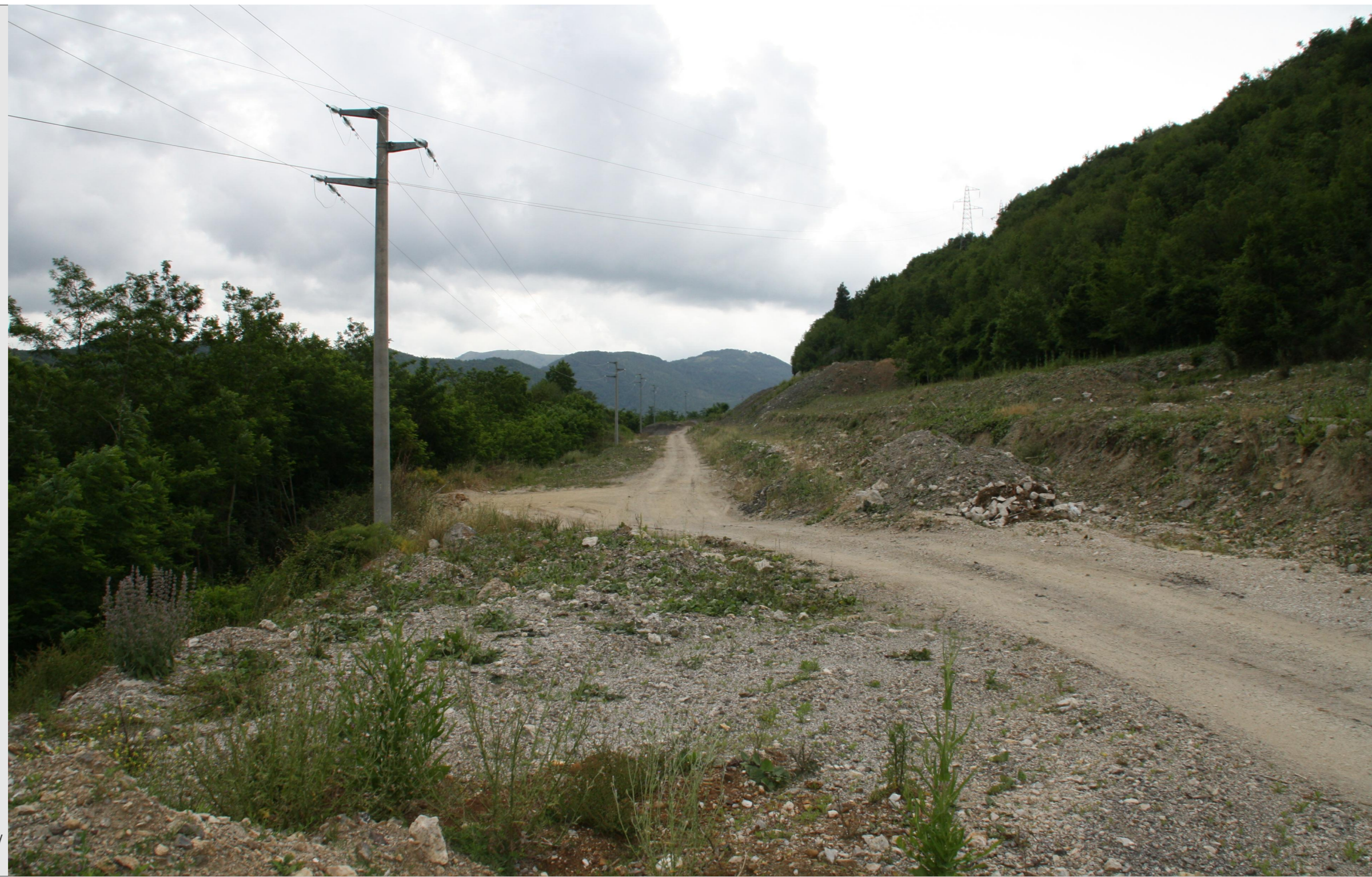
STATO DEI LUOGHI PRIVO DI OPERE DI MITIGAZIONE / RIPRISTINO AMBIENTALE