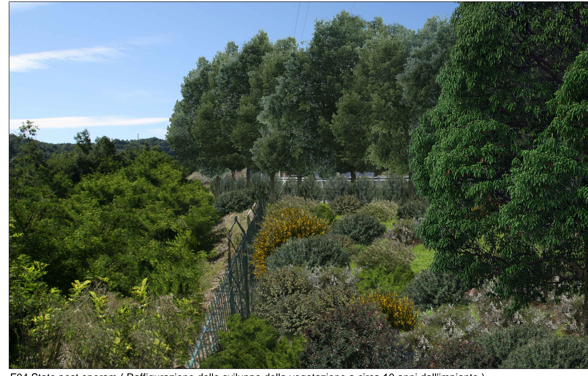
F04 Stato post operam (Raffigurazione dello sviluppo della vegetazione a circa 10 anni dall'impianto)