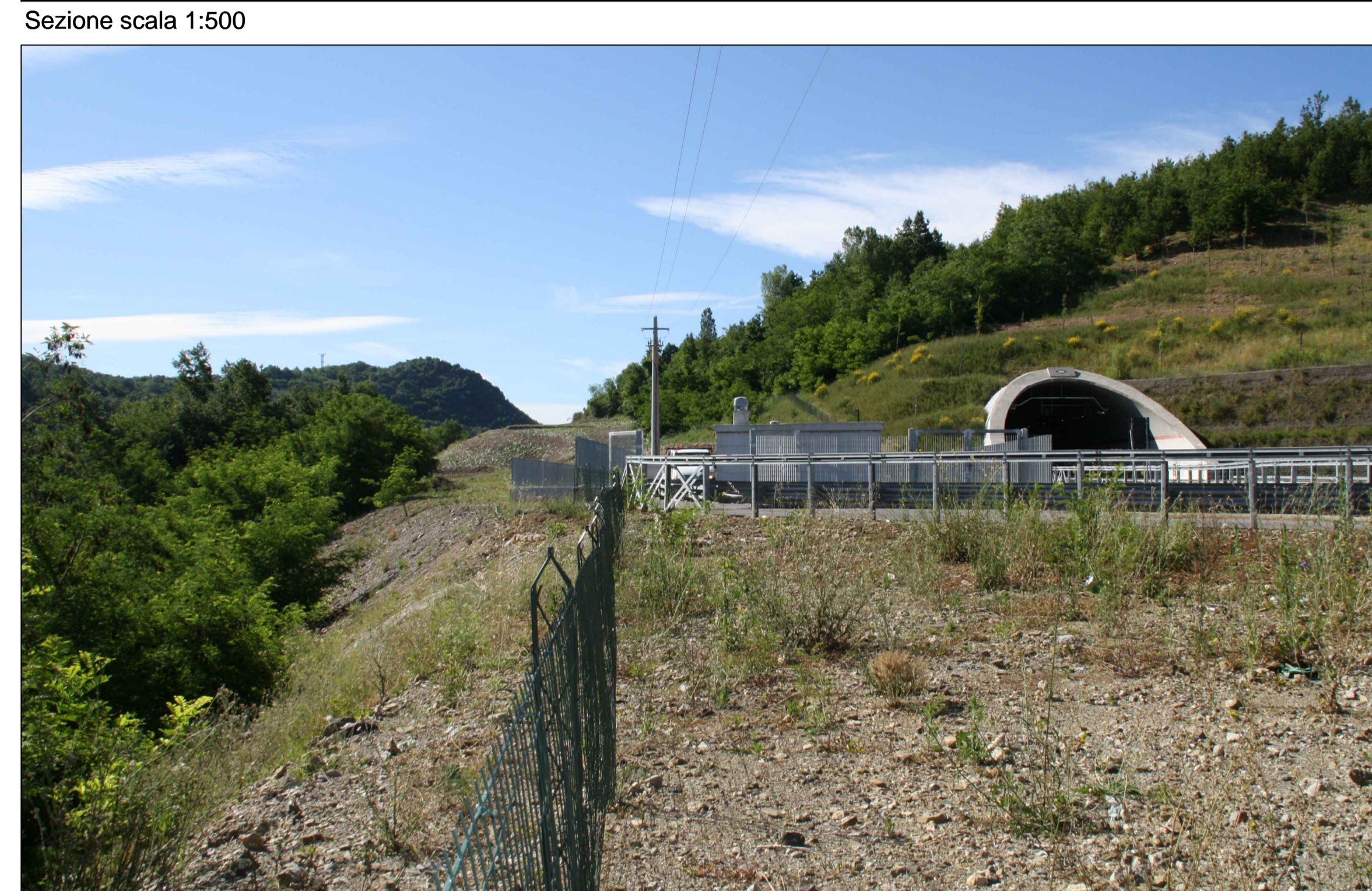
F04 Stato ante operam