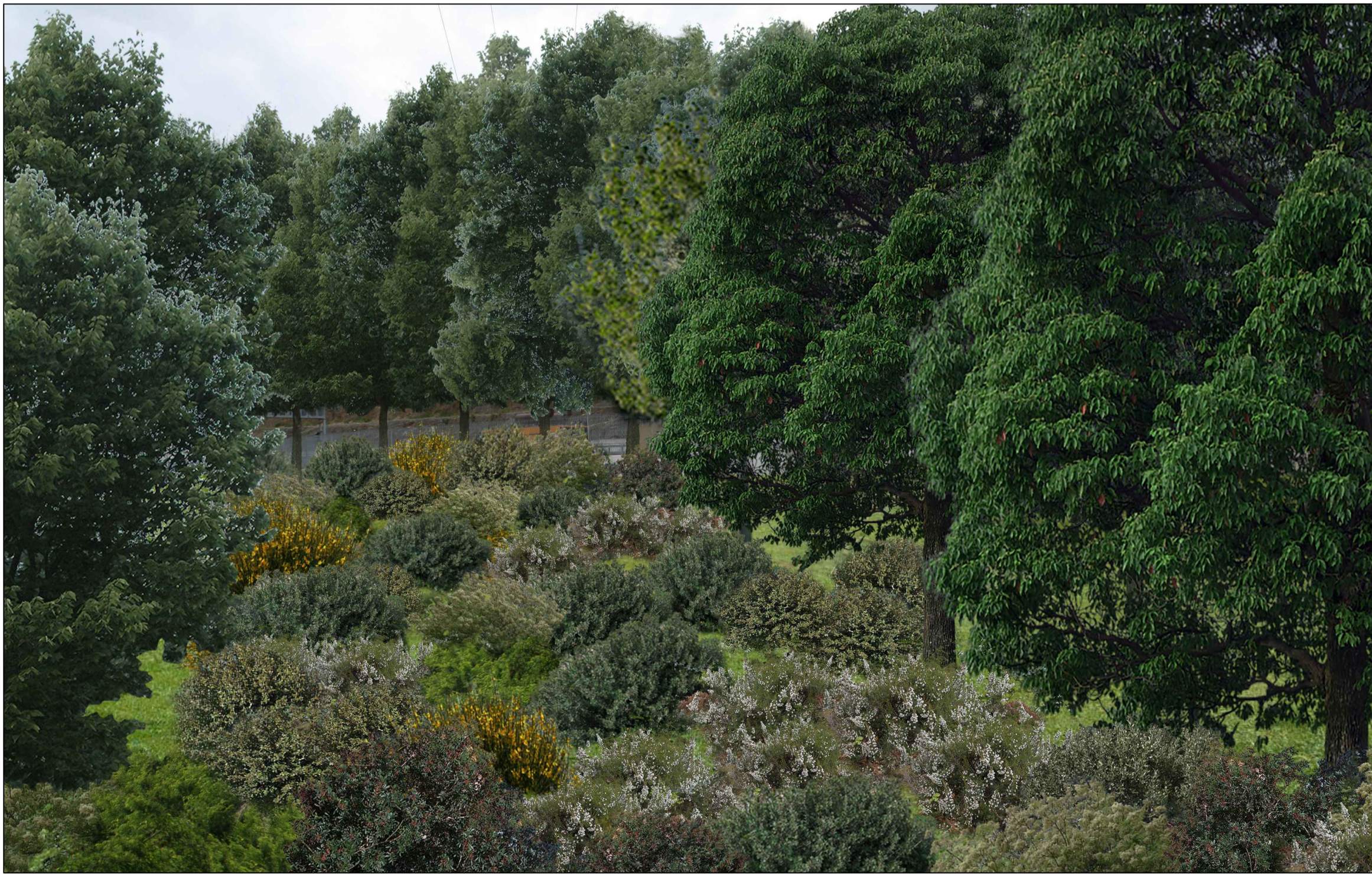
F06 Stato post operam ( Raffigurazione dello sviluppo della vegetazione a circa 10 anni dall'impianto )