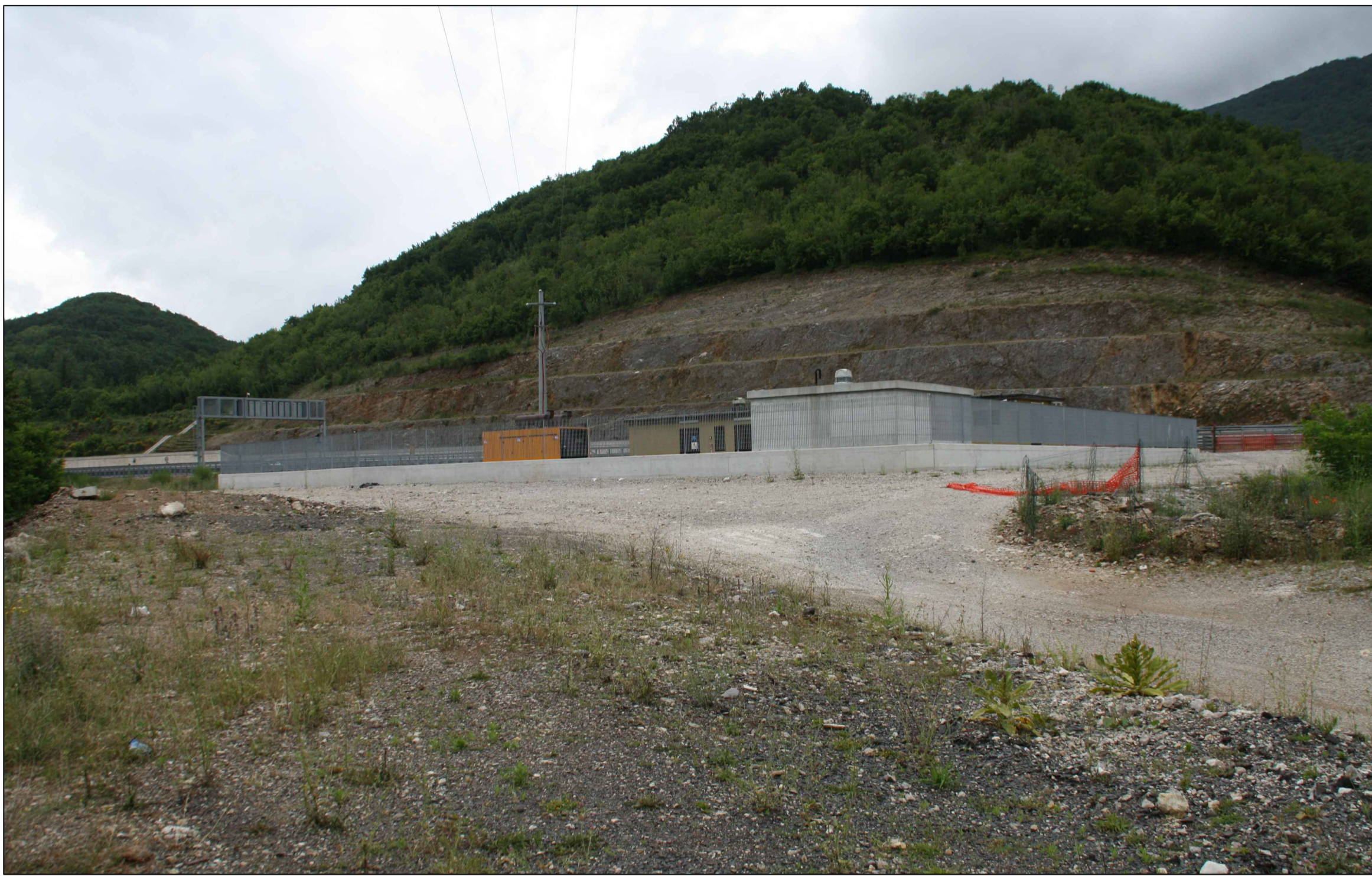
F06 Stato ante operam