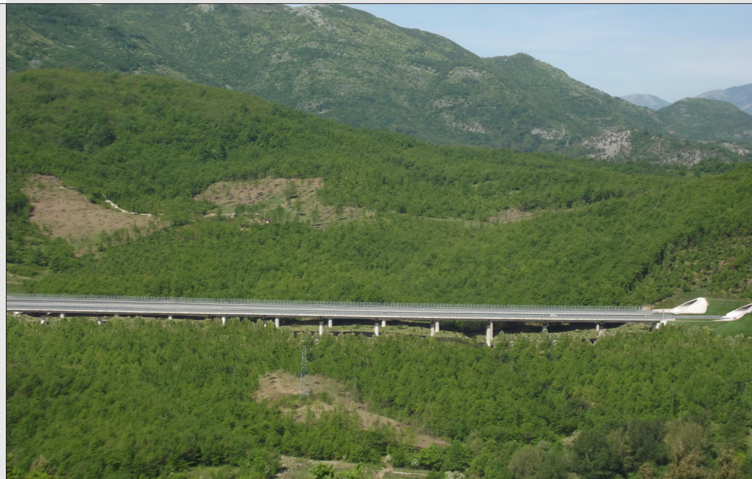
STATO DEI LUOGHI CON OPERE DI MITIGAZIONE / RIPRISTINO AMBIENTALE