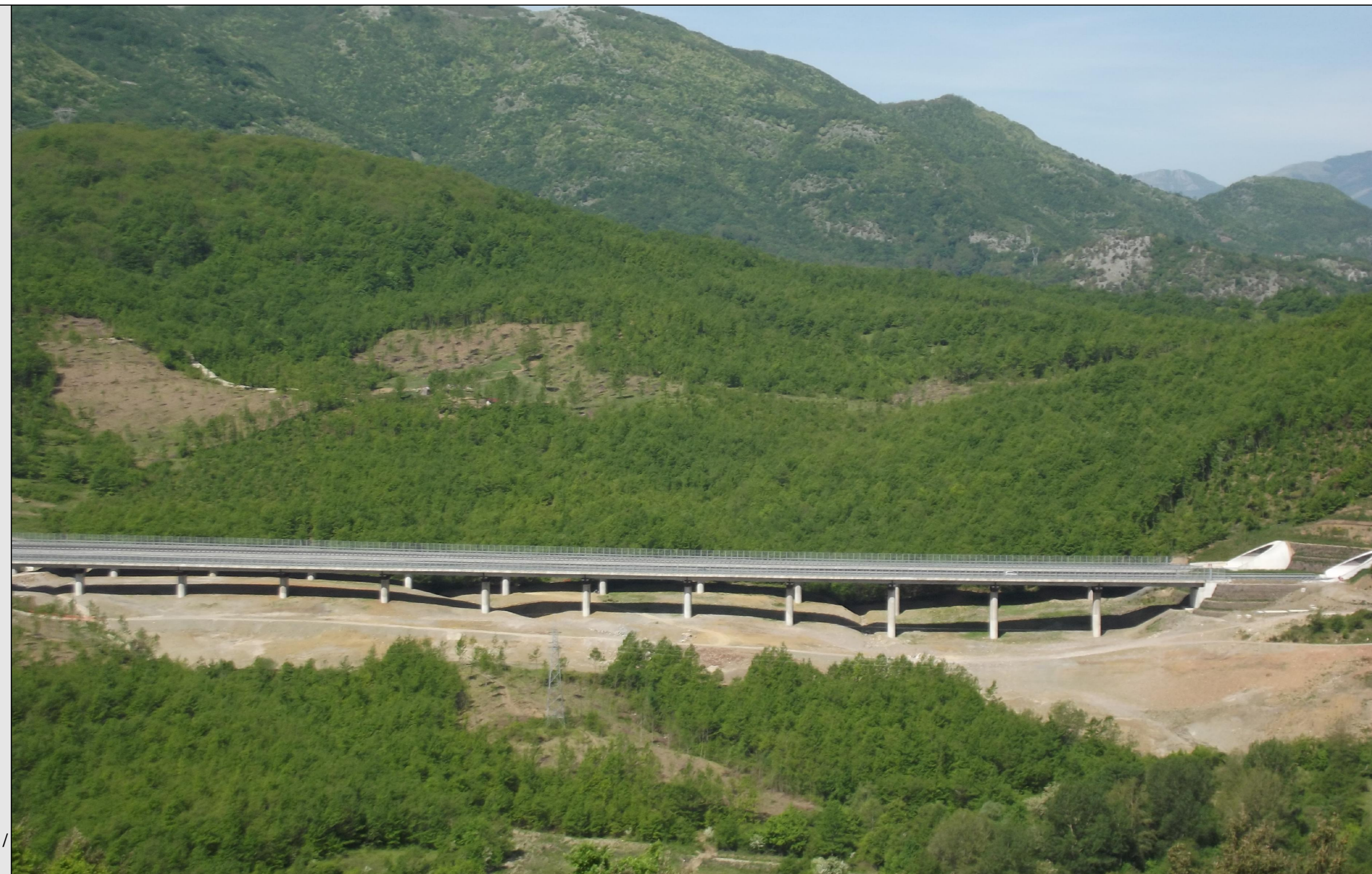
STATO DEI LUOGHI PRIVO DI OPERE DI MITIGAZIONE / RIPRISTINO AMBIENTALE