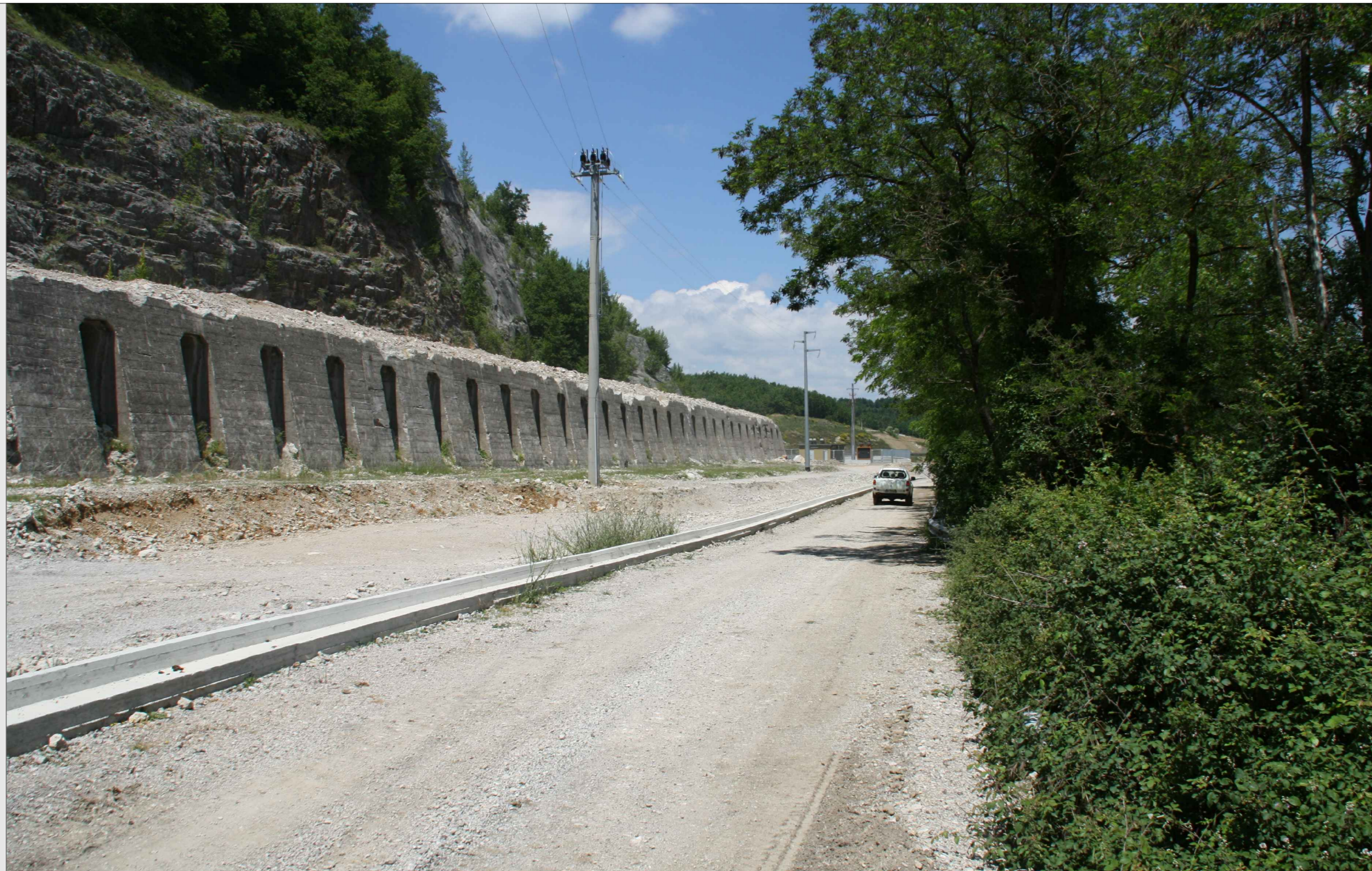
STATO DEI LUOGHI PRIVO DI OPERE DI MITIGAZIONE / RIPRISTINO AMBIENTALE