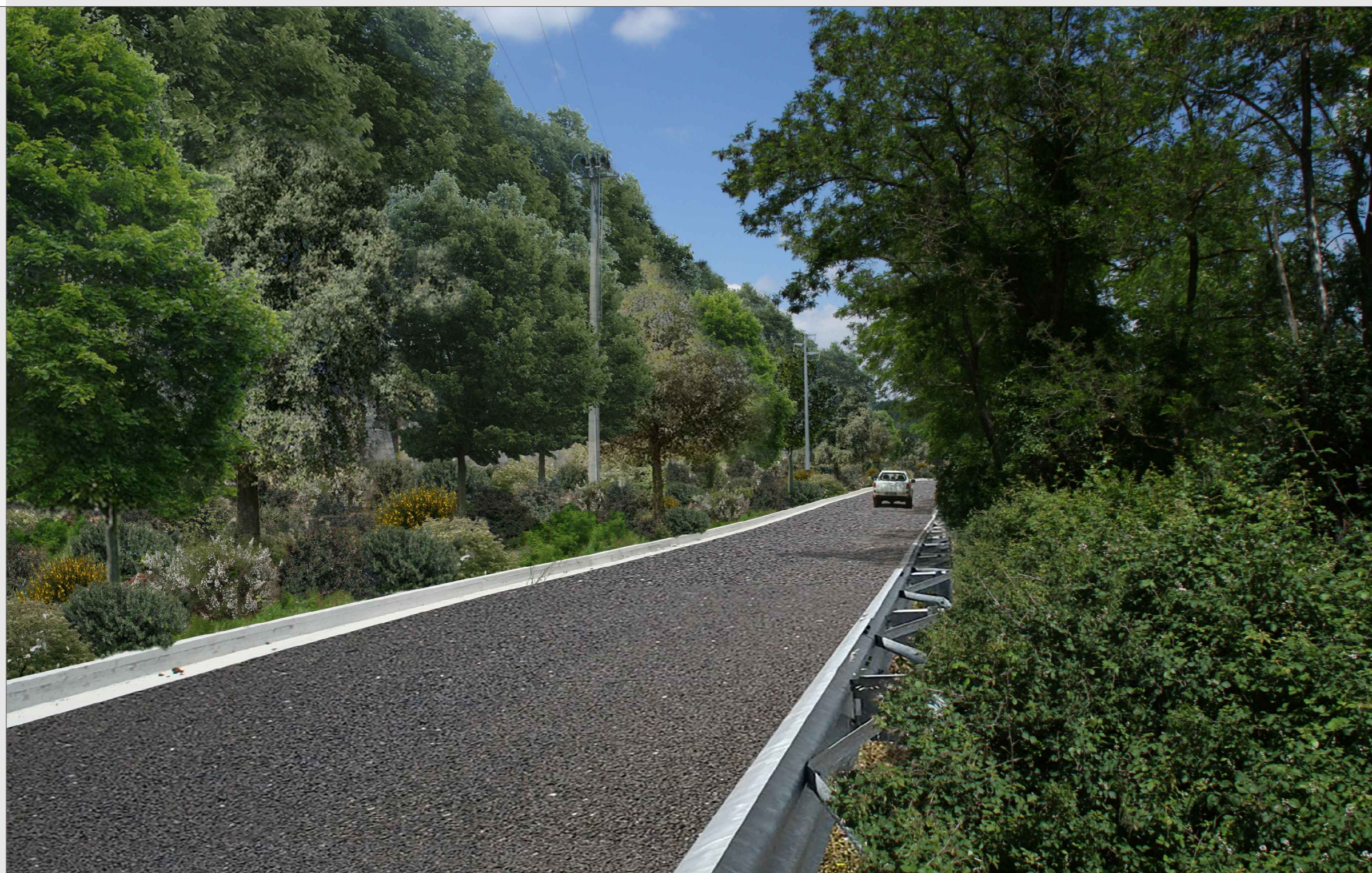
STATO DEI LUOGHI CON OPERE DI MITIGAZIONE / RIPRISTINO AMBIENTALE