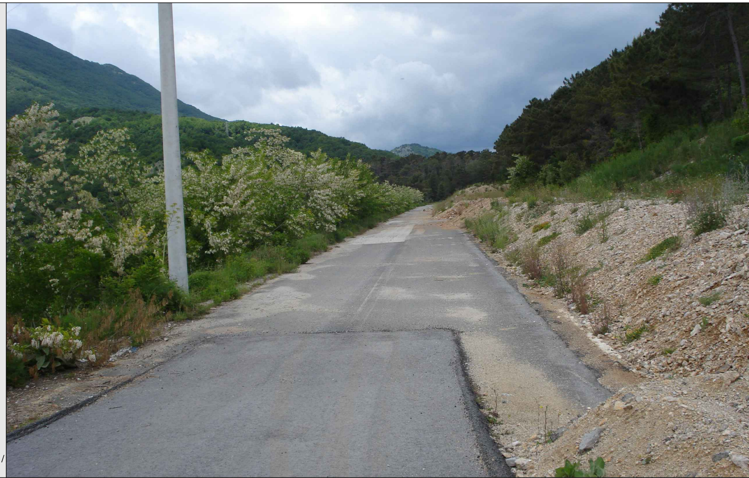
STATO DEI LUOGHI PRIVO DI OPERE DI MITIGAZIONE / RIPRISTINO AMBIENTALE