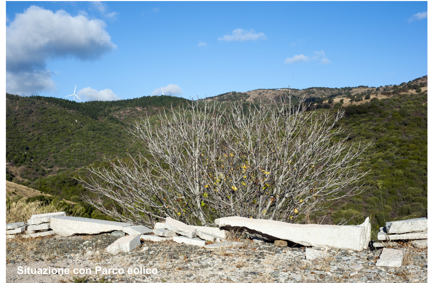
Situazione con Parco eolico