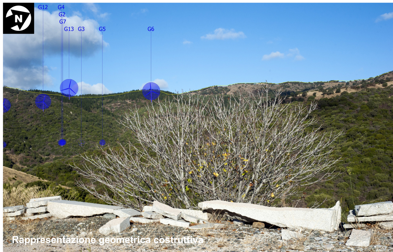
Rappresentazione geometrica costruttiva