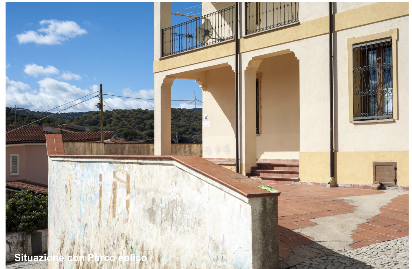
Situazione con Parco eolico