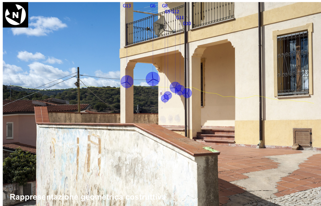
Rappresentazione geometrica costruttiva