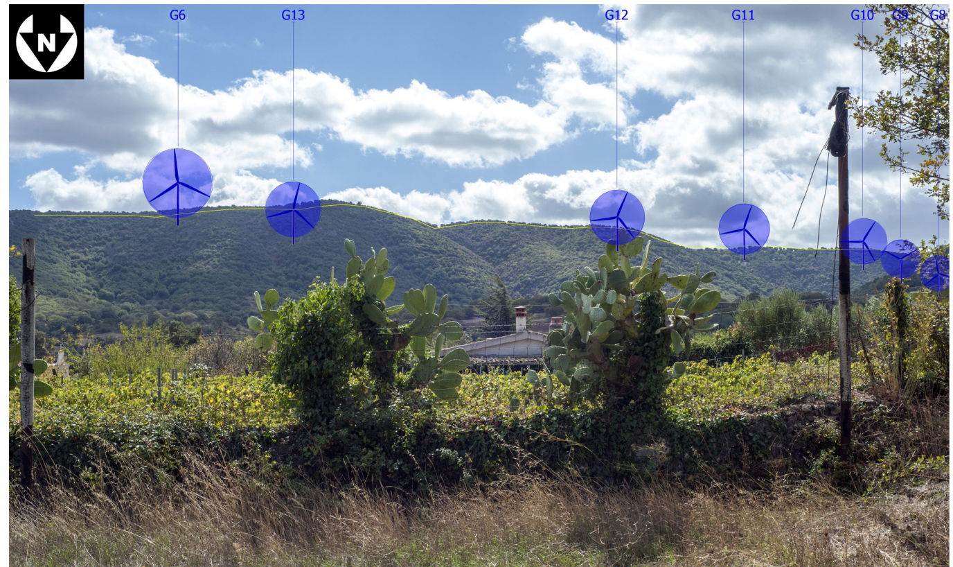
Rappresentazione geometrica costruttiva