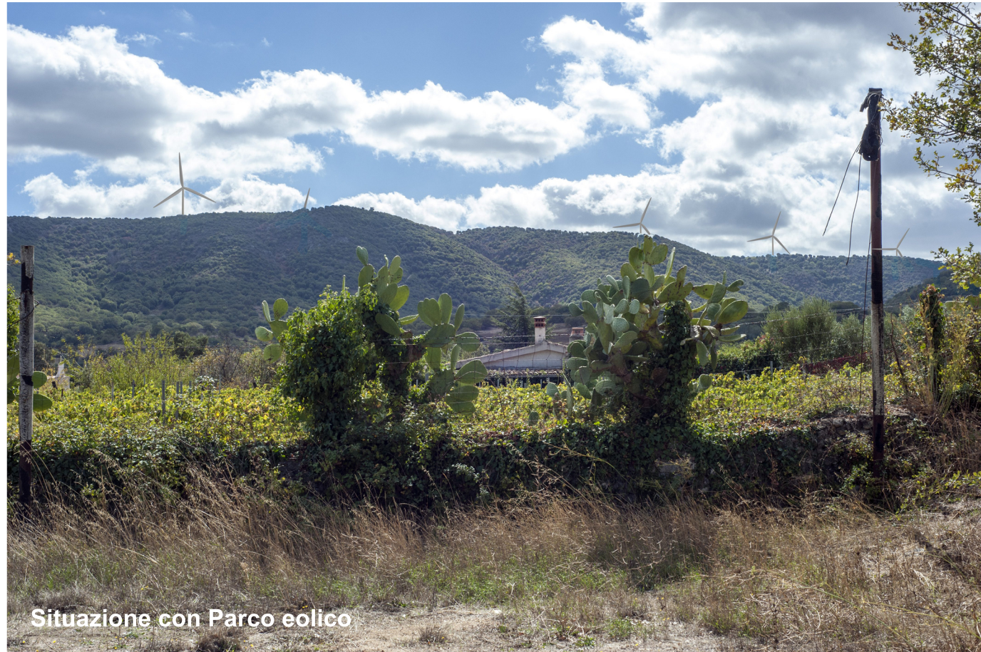
Situazione con Parco eolico