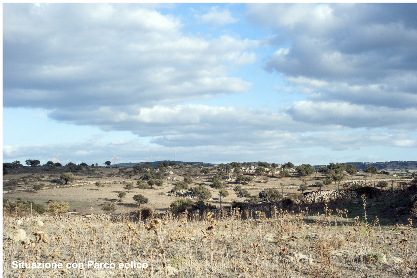
Situazione con Parco eolico