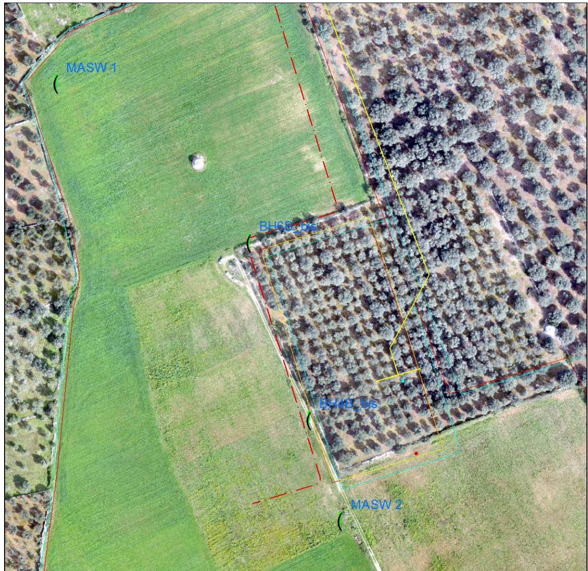
Fig 2.1.A: Ubicazione sondaggi geognostici e masw