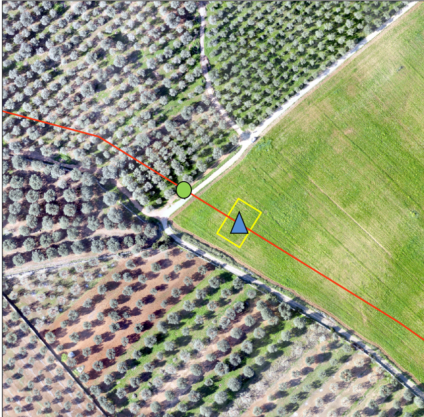
Fig 6.1.A: Ubicazione sondaggi geognostici ( ● ) e masw ( ▲ )