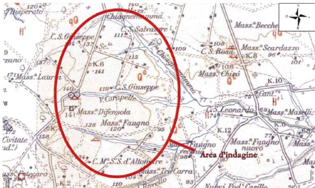
STRALCIO DELLA CARTA GEOLITOLOGICA UFFICIALE 1.100.000