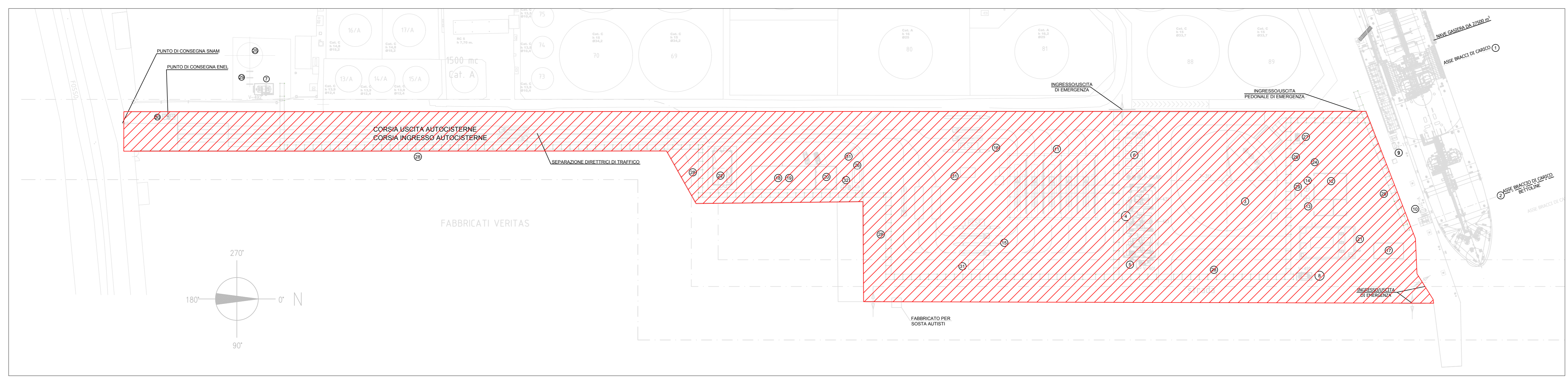
FASE 2: - PREPARAZIONE SITO