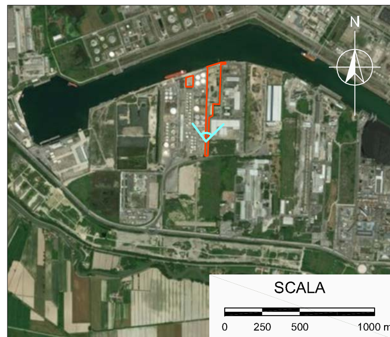
MAPPA DEL PUNTO DI VISTA FOTOGRAFICO