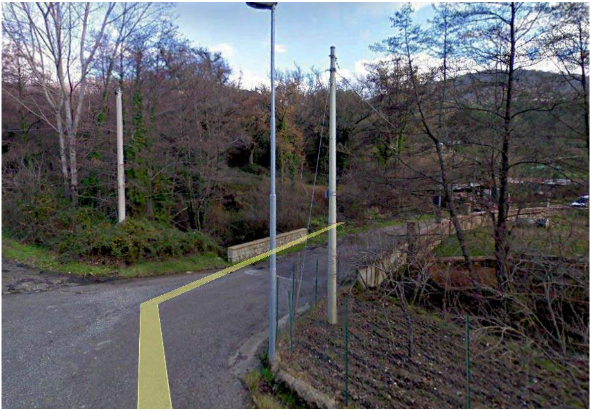
FOTO1 (TRATTO AB)