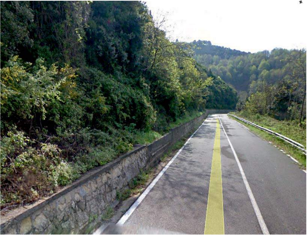
FOTO1 (TRATTO AB)