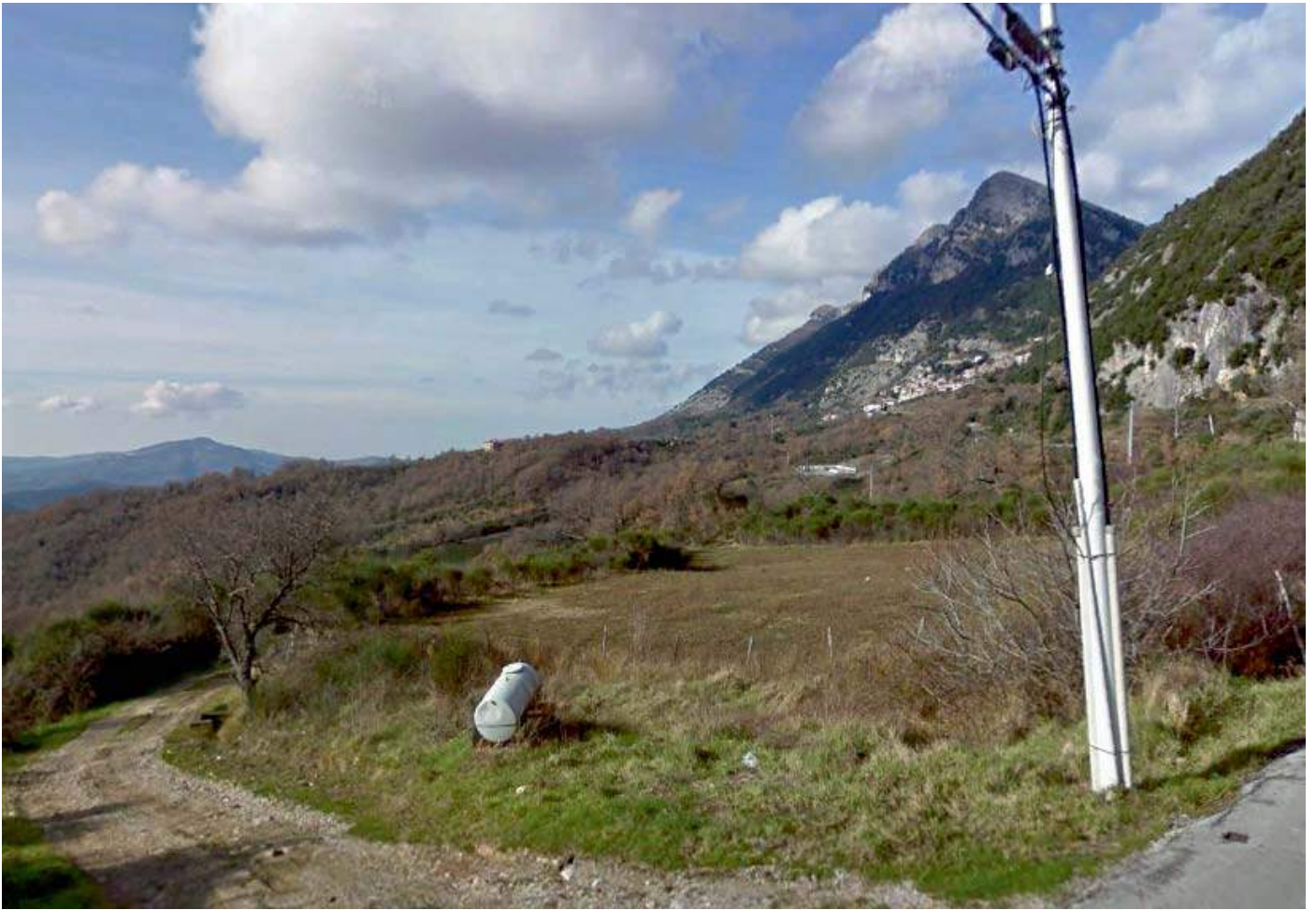
FOTO1 (tratto A B )