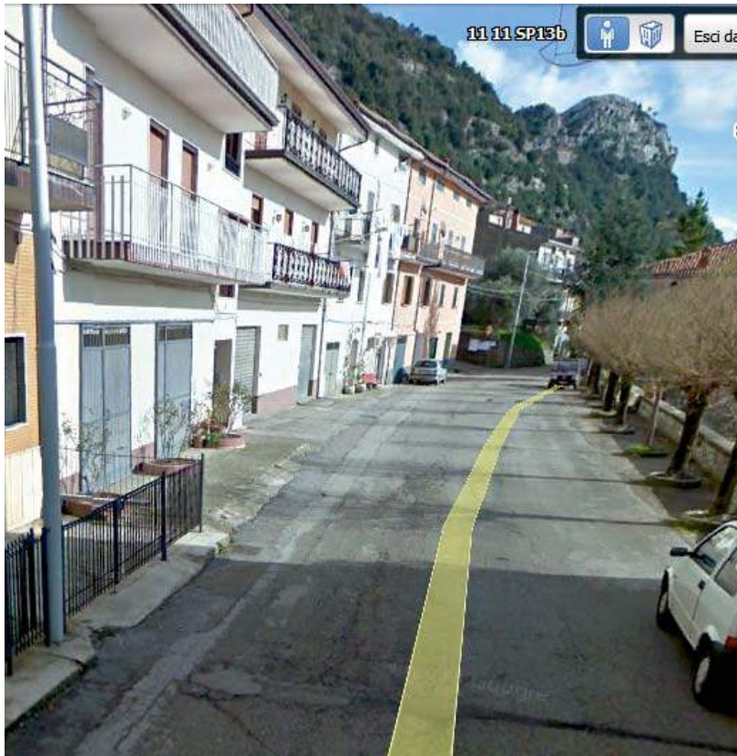
FOTO3 (TRATTO A B - punto B)