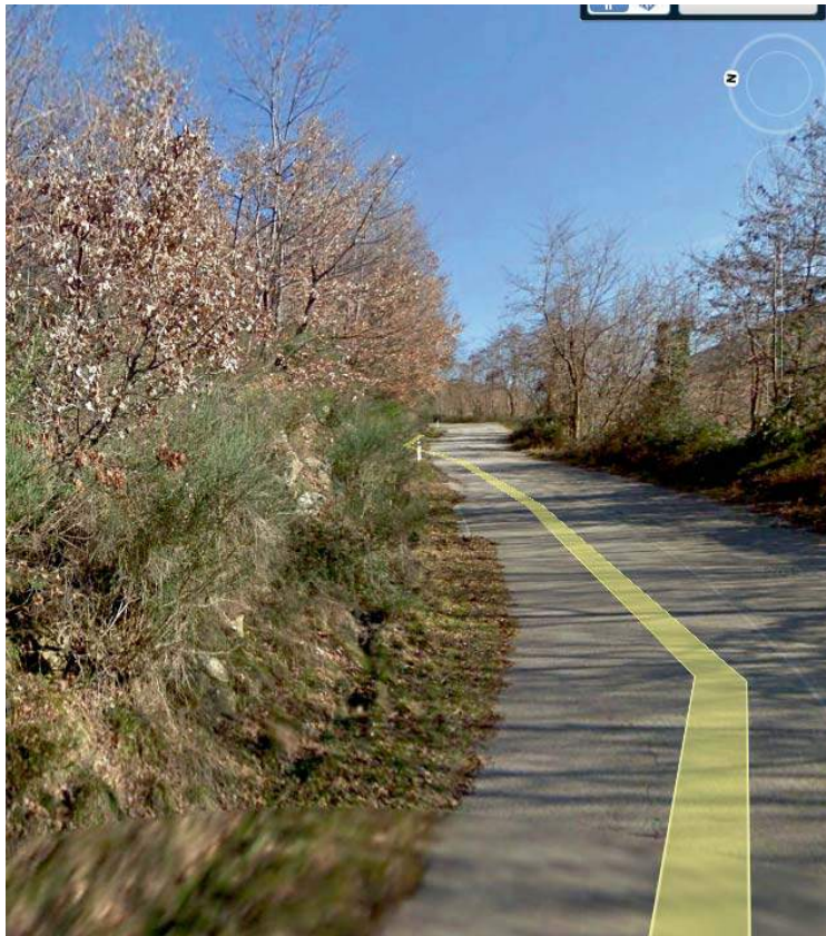
FOTO3 (TRATTO A B C - PUNTO C )