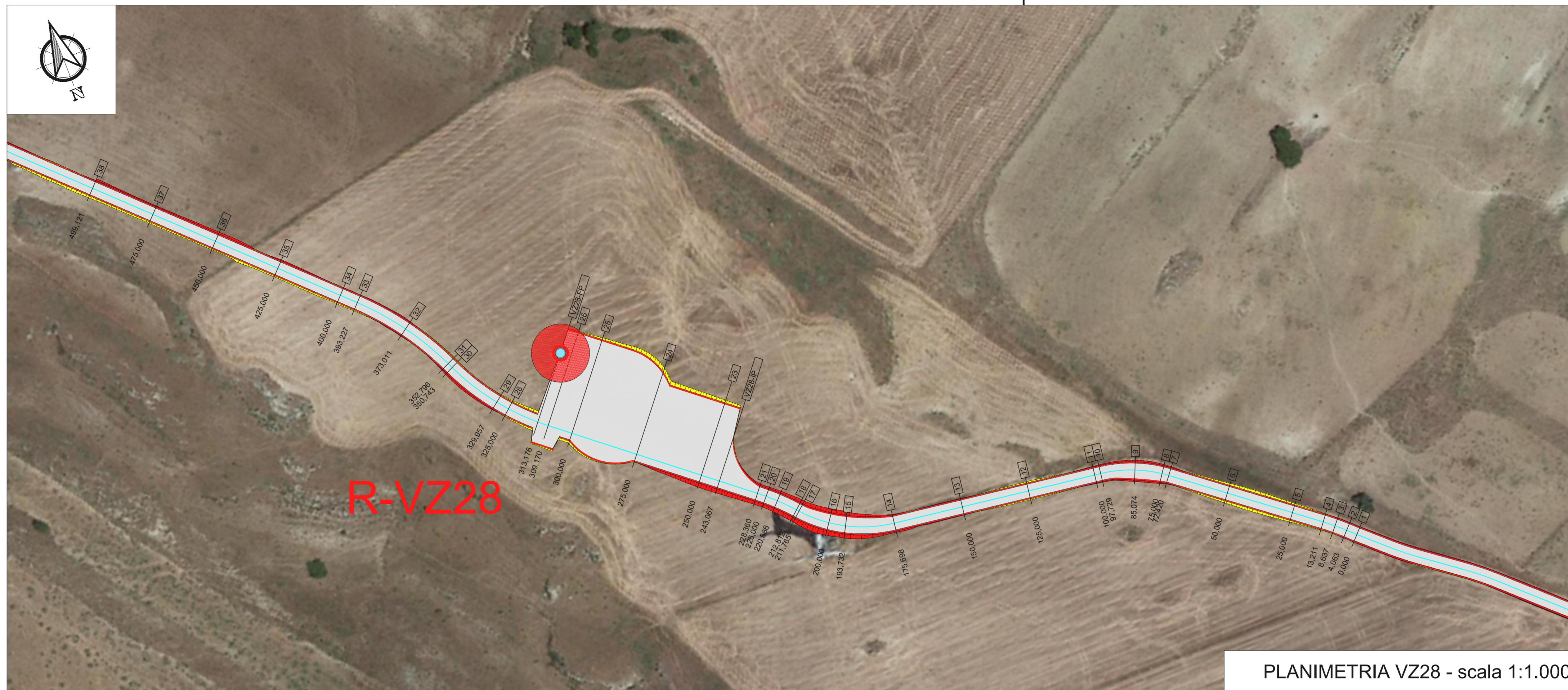
PLANIMETRIA VZ28 - scala 1:1.000