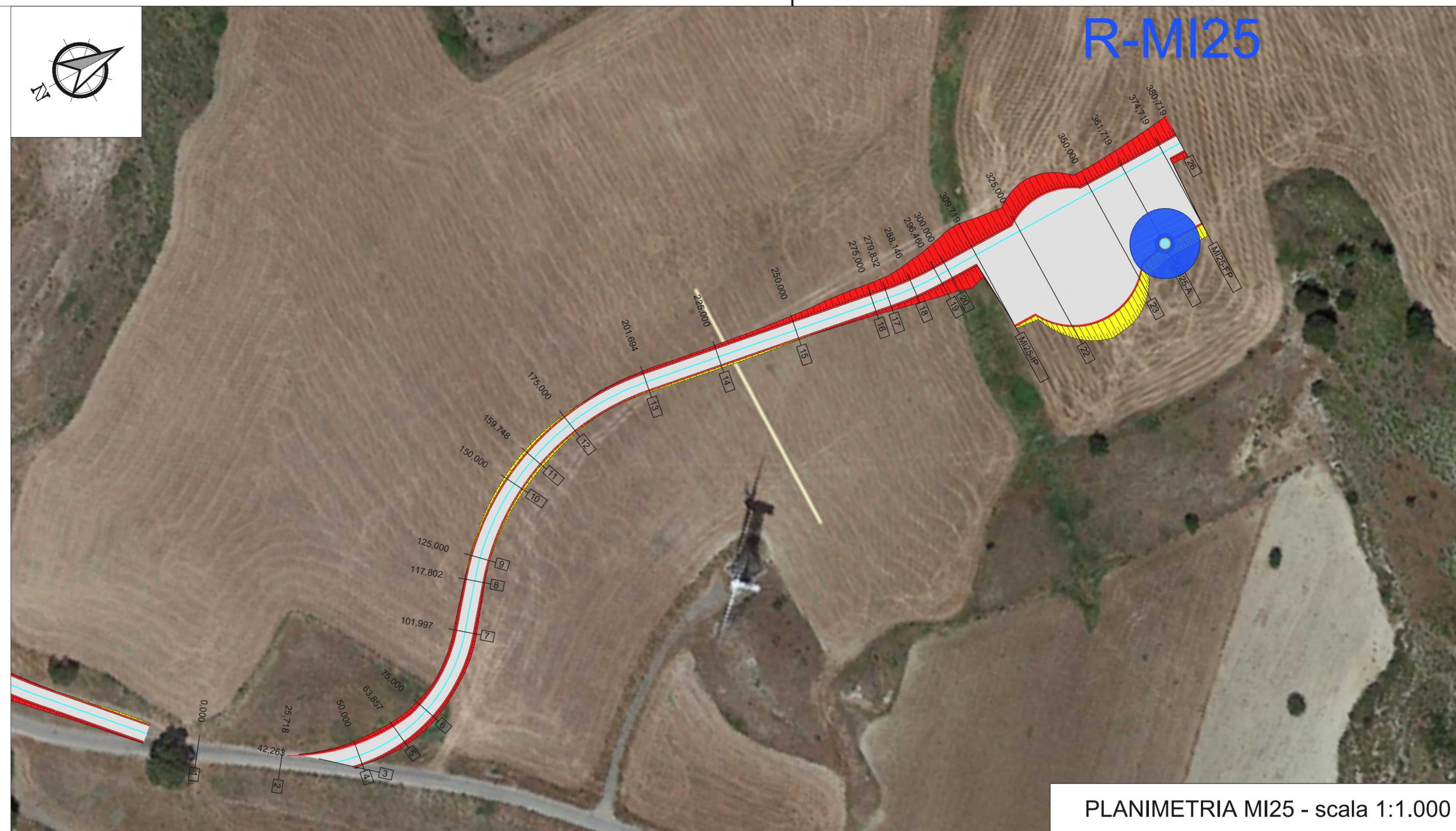
PLANIMETRIA MI25 - scala 1:1.000