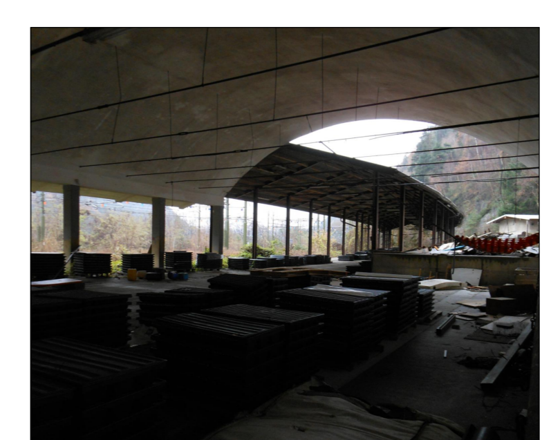
FOTO 2 - VISTA CANTIERE OPERATIVO C.O.01A - DEPOSITO ESISTENTE DA DEMOLIRE