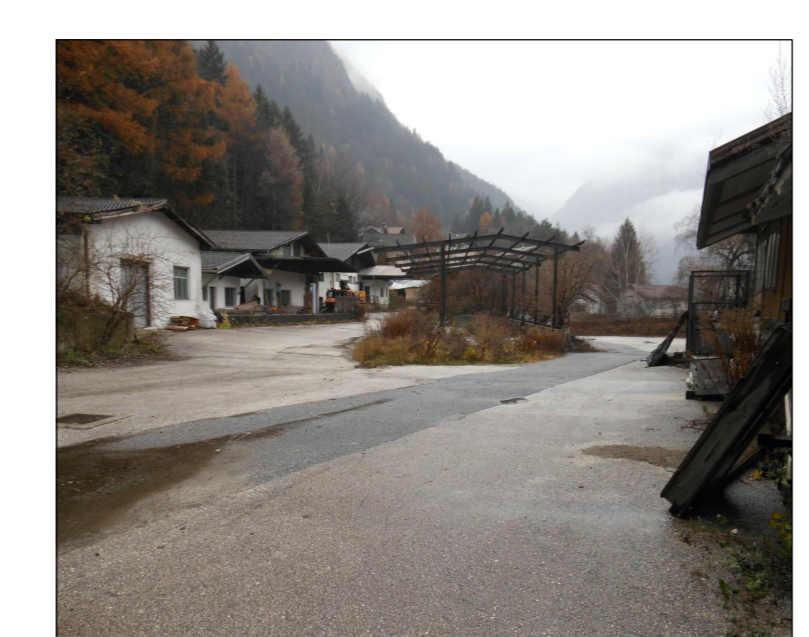
FOTO 1 - VISTA CANTIERE OPERATIVO C.O.01A - TETTOIA ESISTENTE DA DEMOLIRE