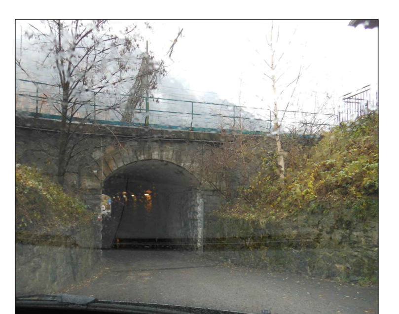
FOTO 3 - SOTTOVIA ESISTENTE