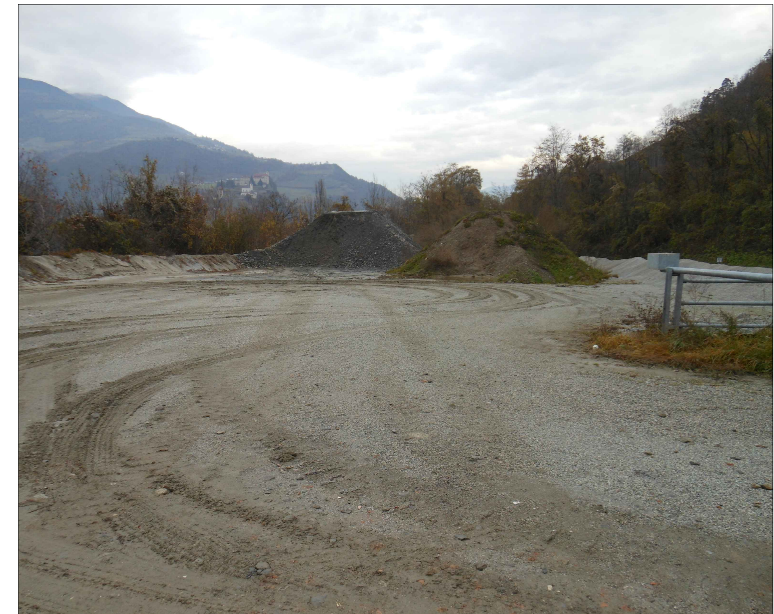
FOTO 1 - INGRESSO AS.05 VERSO NORD