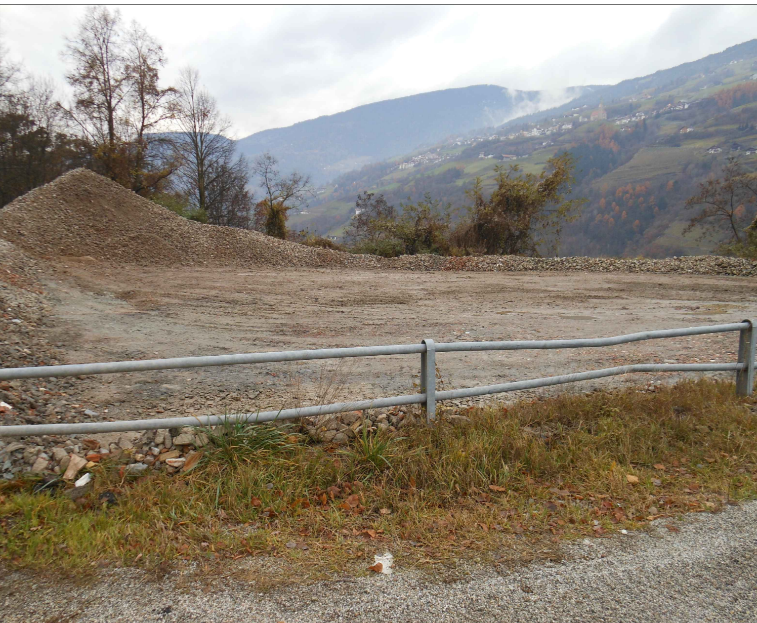
FOTO 2 - INGRESSO AS.05 VERSO SUD