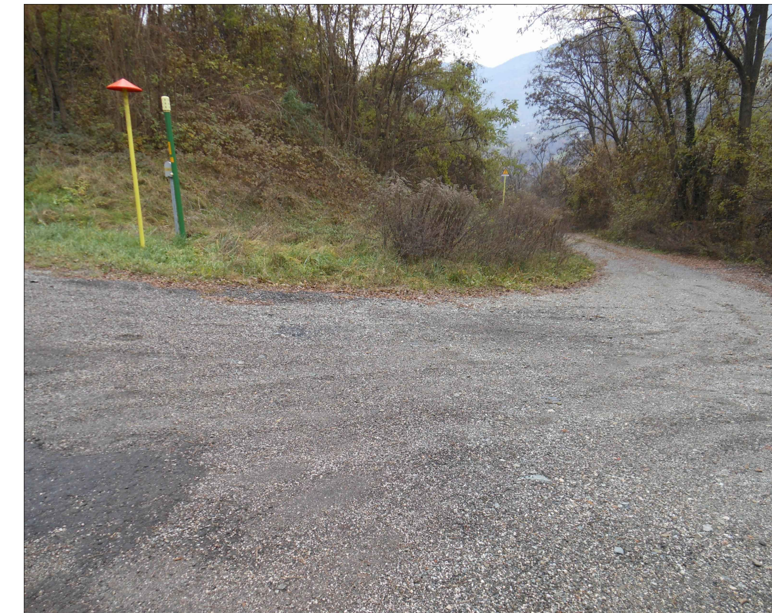
FOTO 5 - VISTA DEVIAZIONE STRADA STATALE 242D