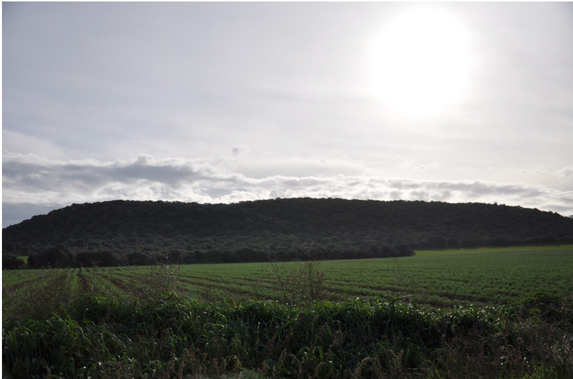
FOTO 1 (particolare della macchia mediterranea e oliveti rinaturalizzati)