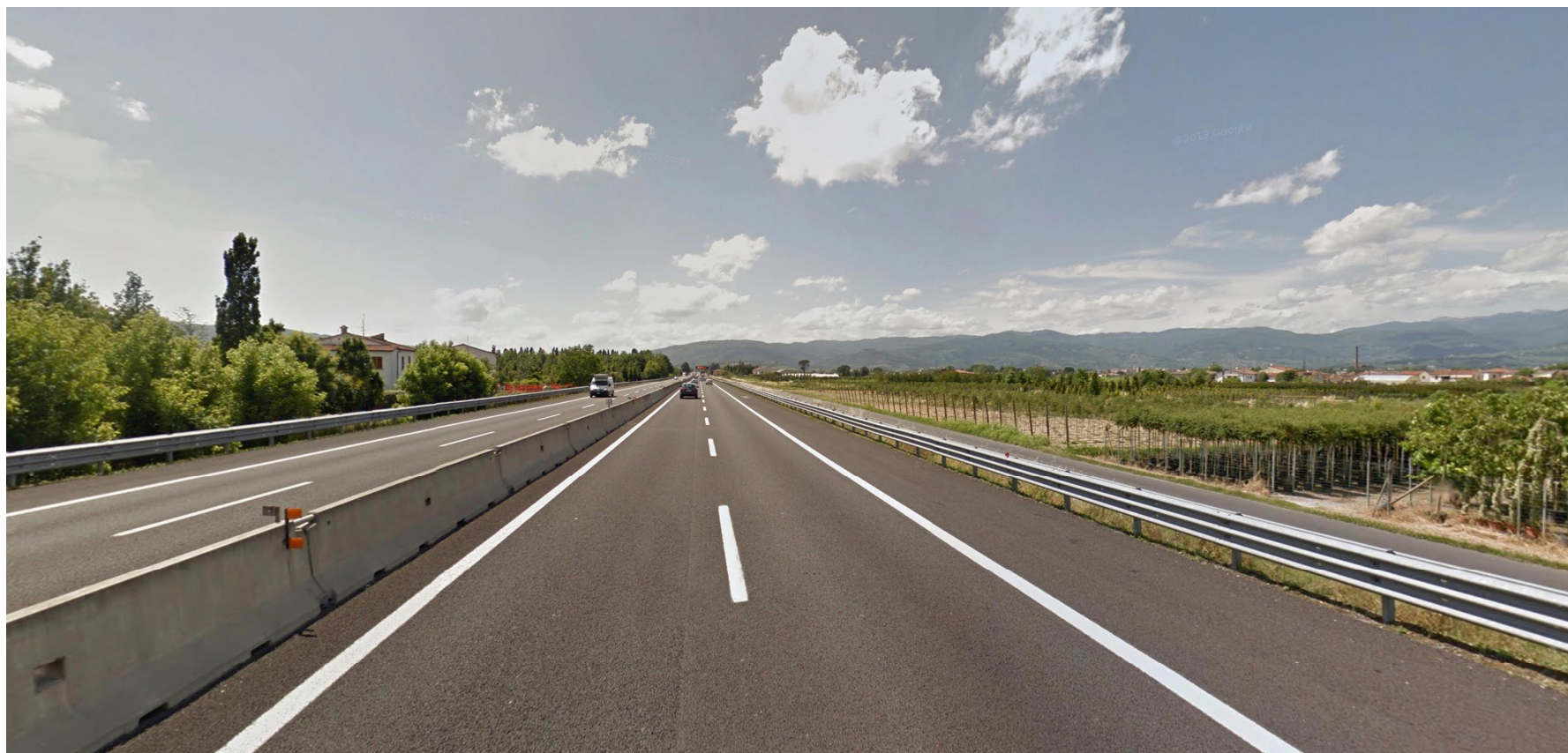
Vista 1, stato ante operam diurno