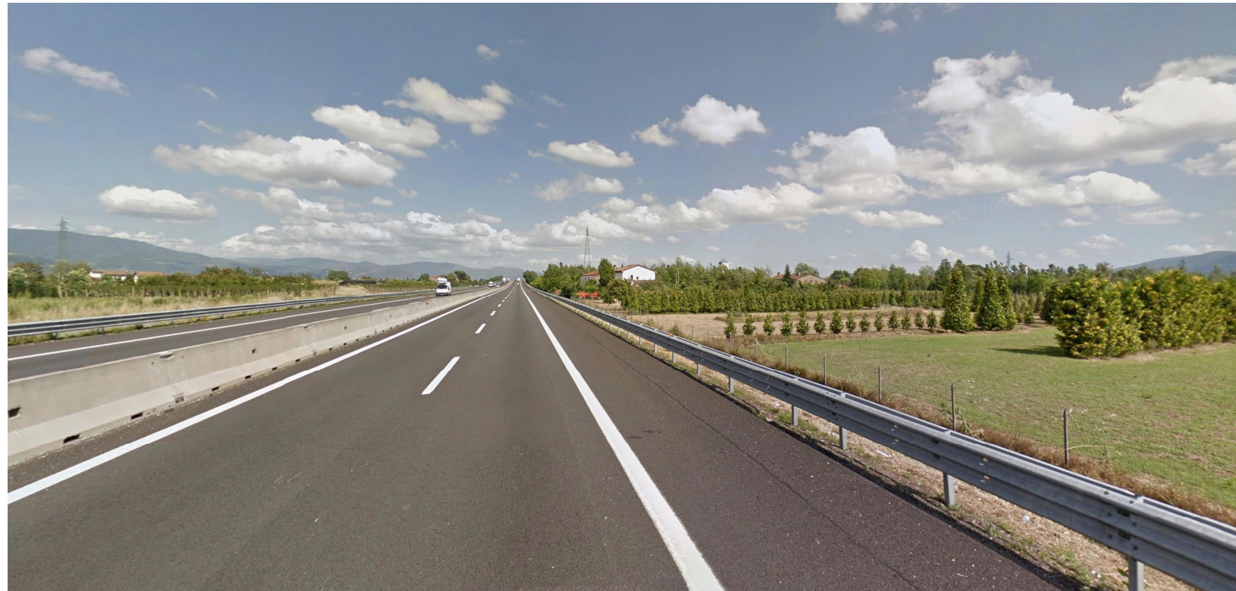
Vista 3, stato ante operam diurno