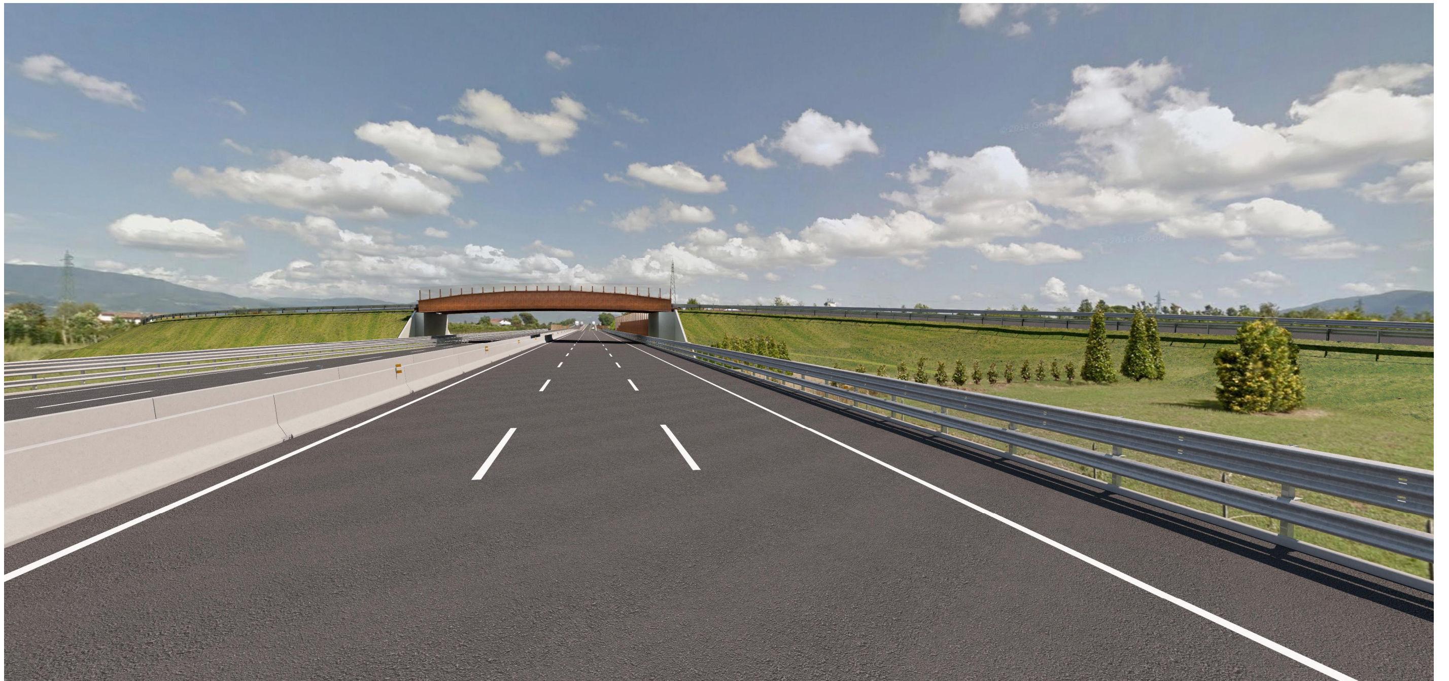
Fotosimulazione 3, diurna