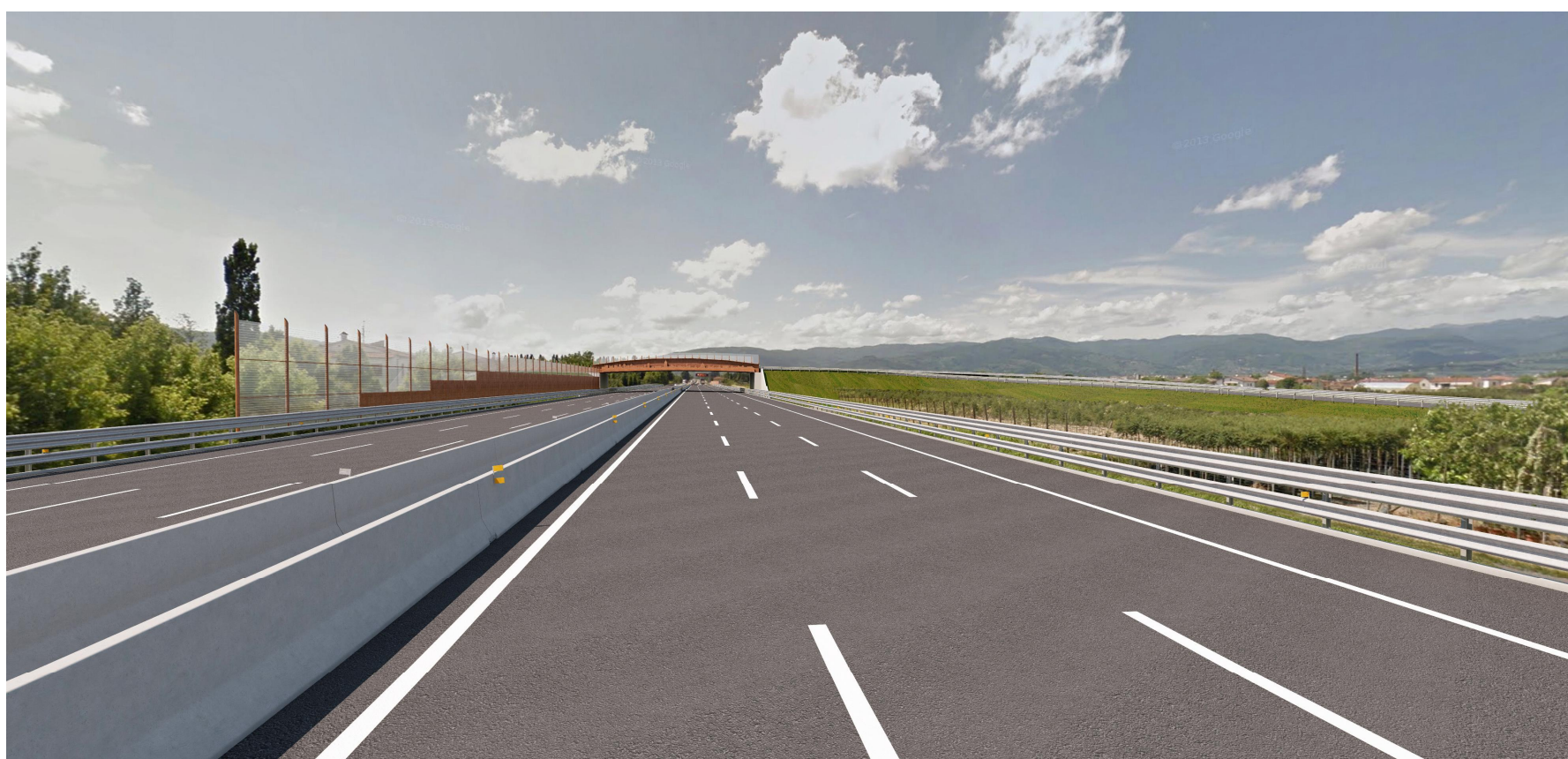
Vista 1, stato post operam diurno