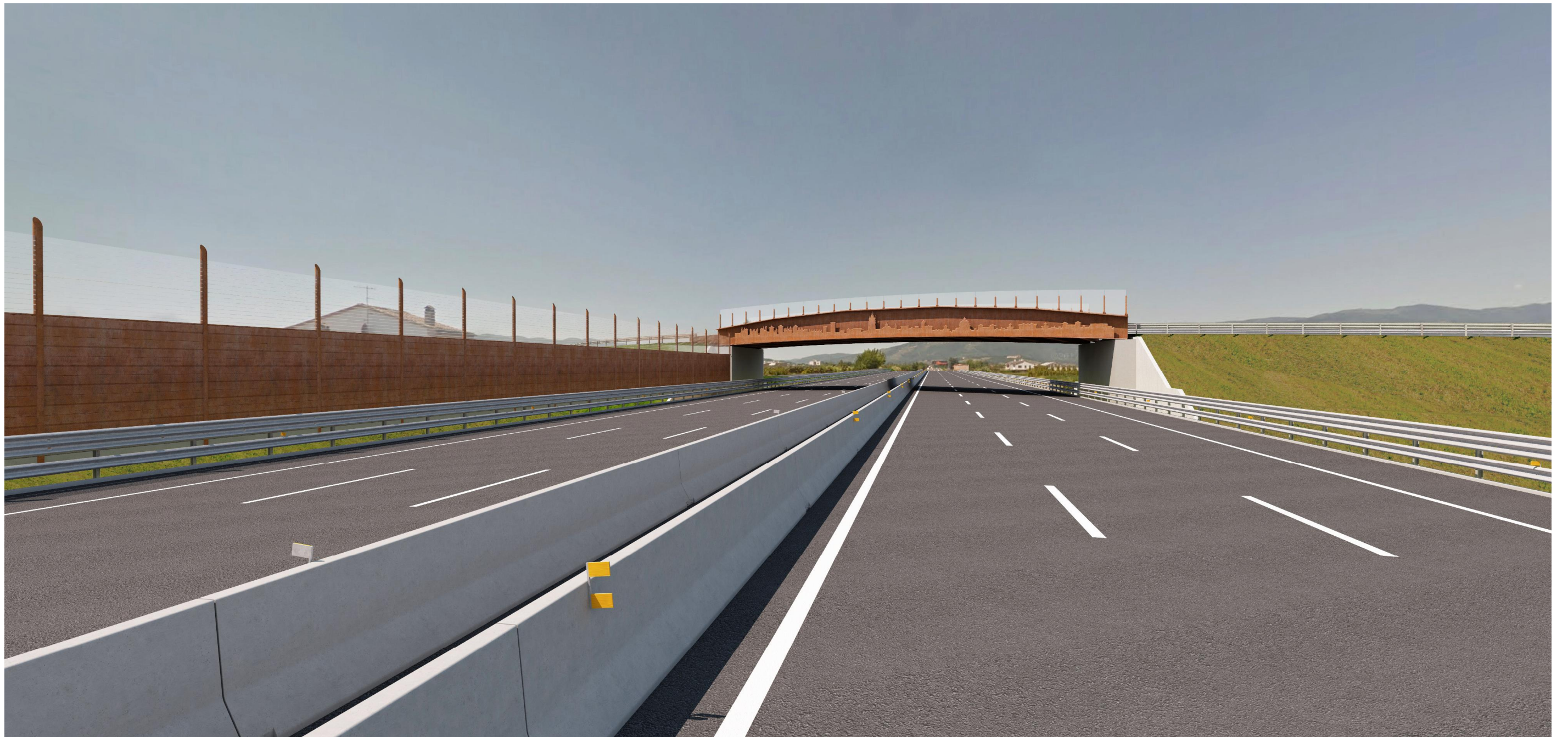
Fotosimulazione 2, diurna