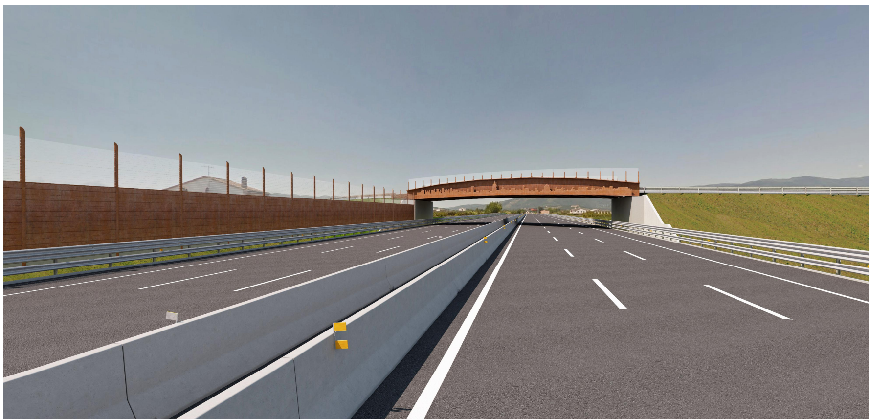
Vista 2, stato post operam diurno