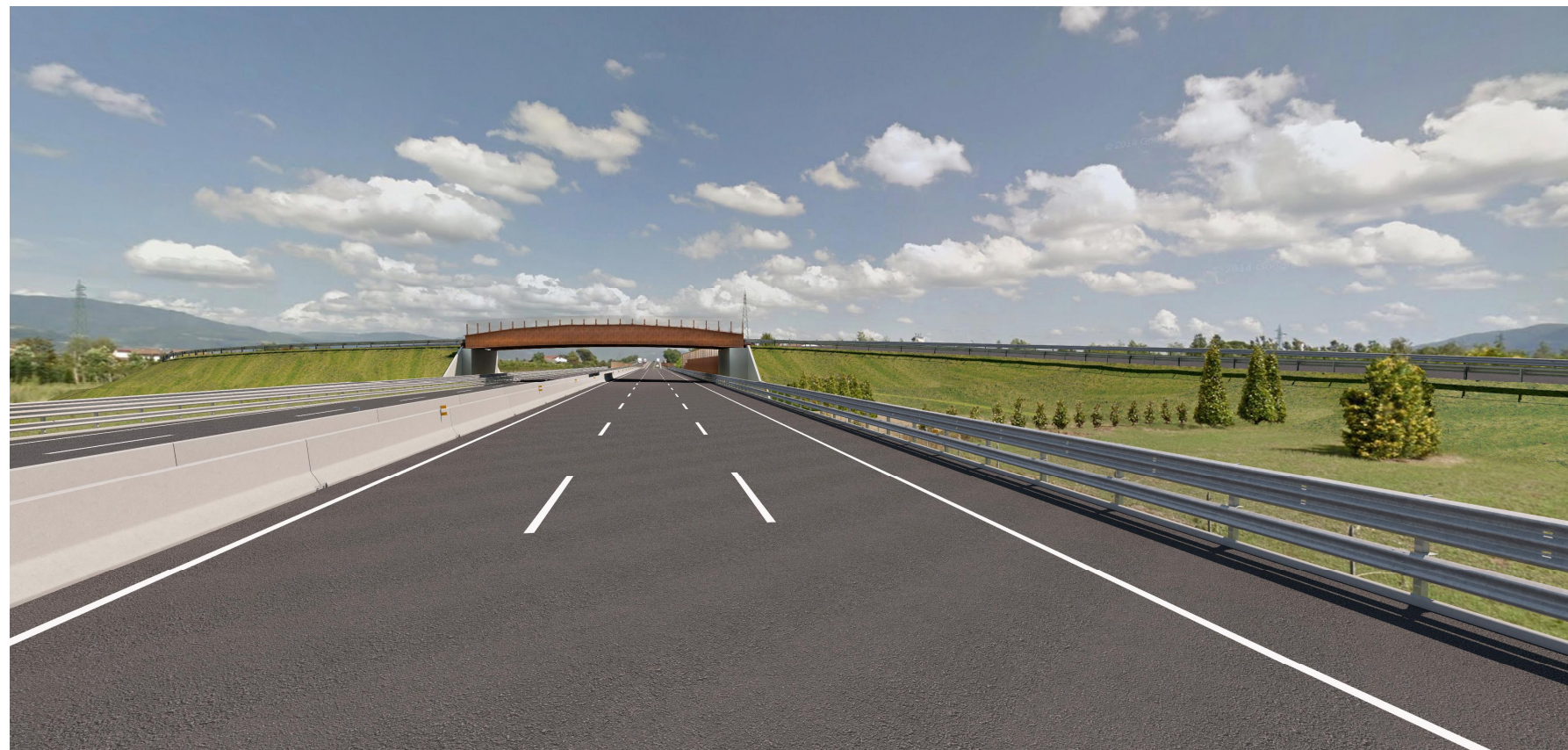
Vista 3, stato post operam diurno