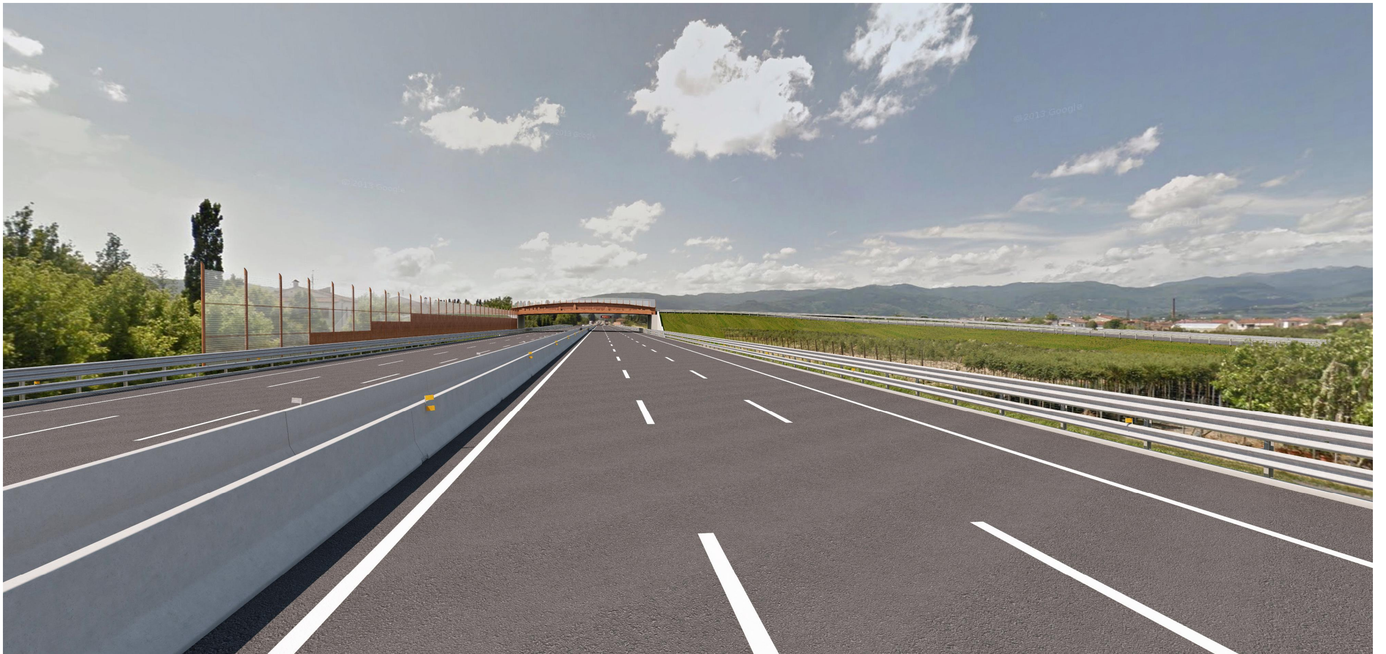
Fotosimulazione 1, diurna