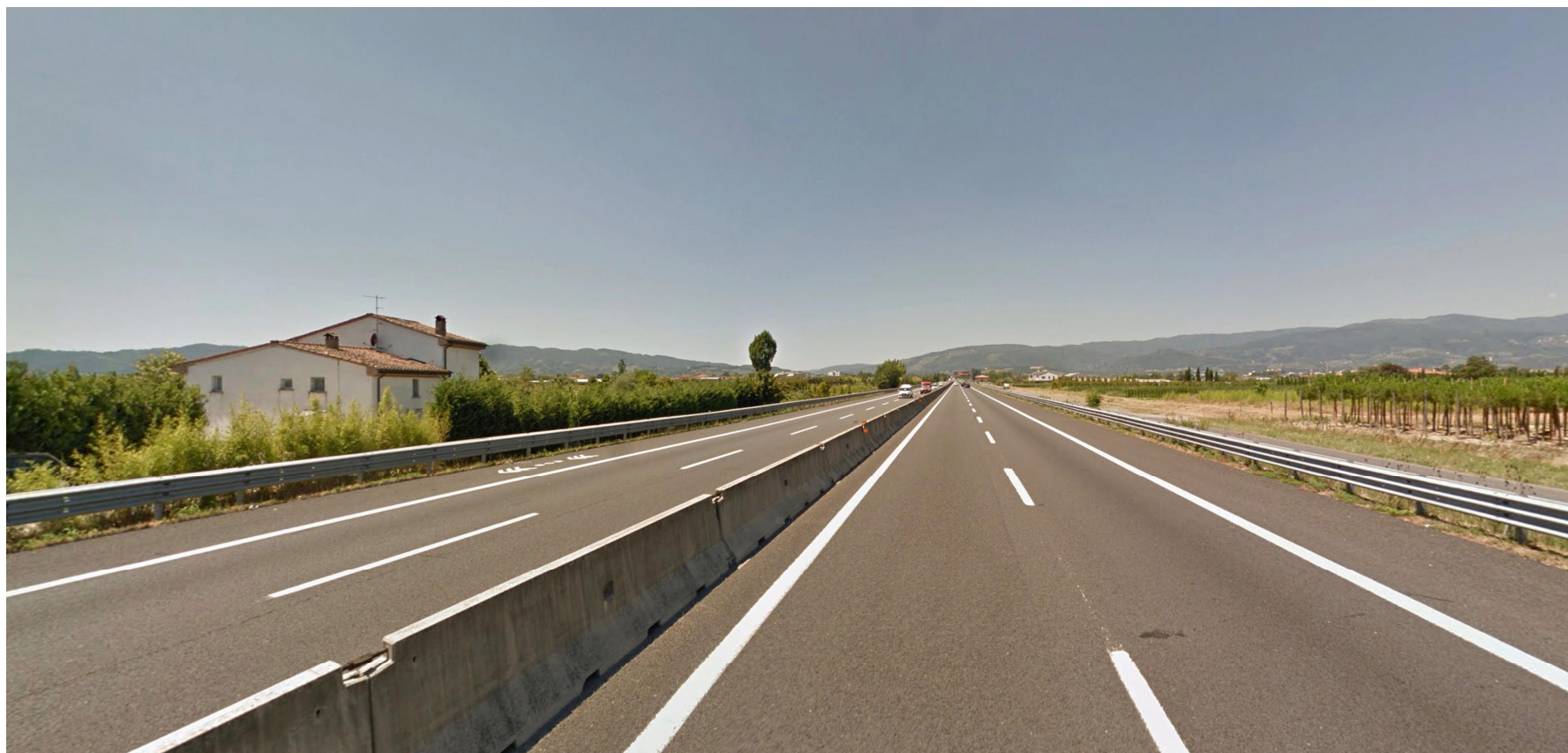
Vista 2, stato ante operam diurno