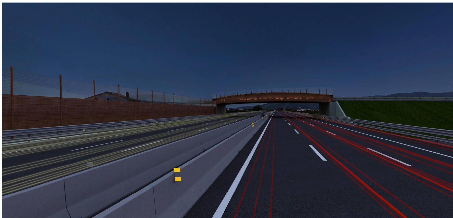
Vista 2, stato post operam notturno