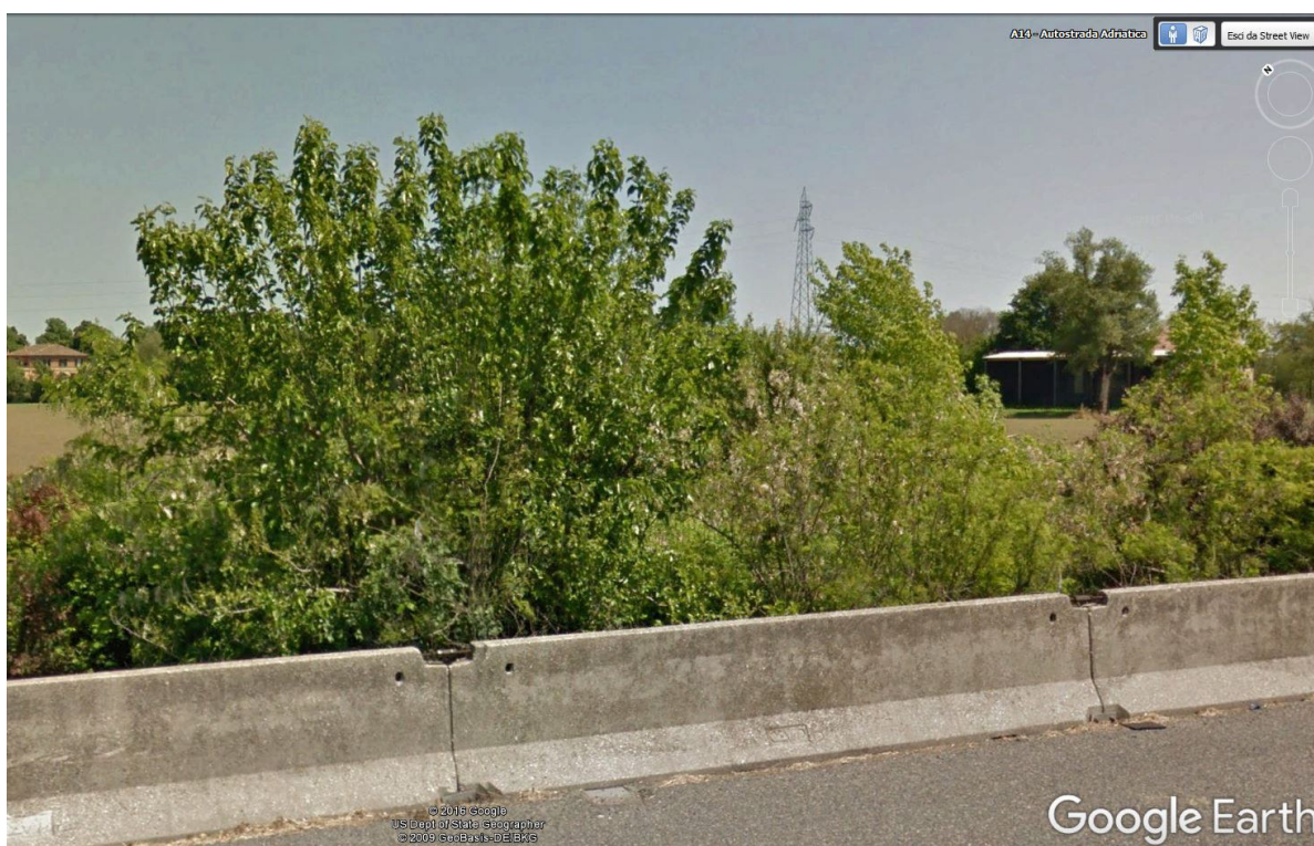
Foto 1: esempio di visualizzazione presa da Google maps con street view

La presenza di tali elementi è stata inoltre verificata anche con le immagini desunte da street view di google maps con cui si è affinato ulteriormente il dato.