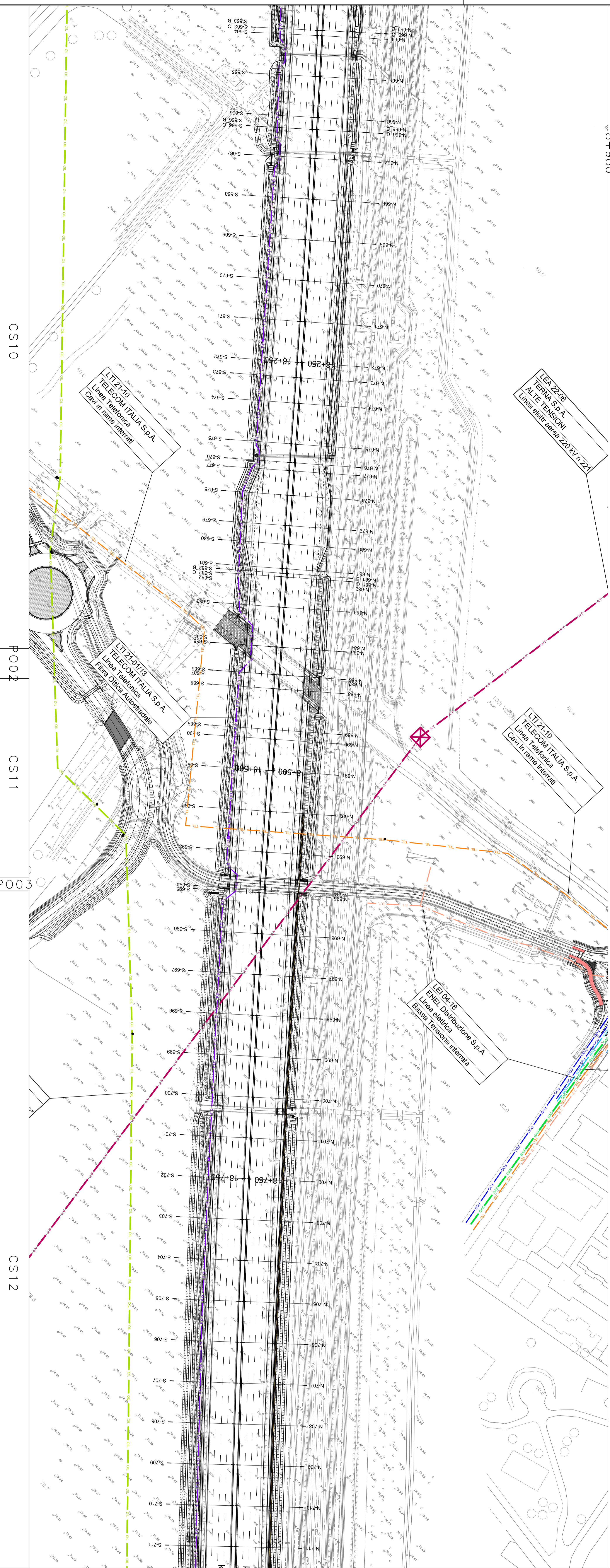
PLANIMETRIA (1:1.000) da km 18+080 a km 18+980