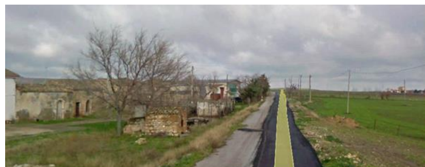
Figura 8 – Attraversamento cavidotto esterno in area di rispetto "Masseria D'Amendola" – viabilità locale

A seguire si riporta la foto del tratto previsti nell'area di rispetto delle componenti culturali ed insediative.