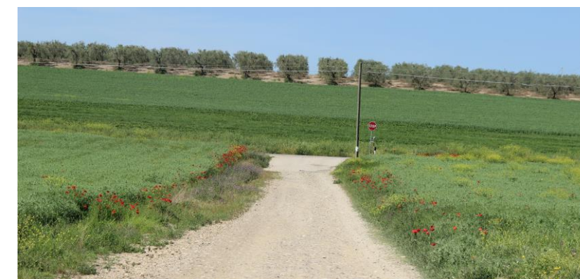
Figura 7 – Strada di accesso alla torre A1 dalla SP110 da sistemare in corrispondenza della fascia di rispetto del "Canale Nannarone e Vallone Valle del Forno"

Per quanto riguarda l'adeguamento di viabilità esistente che conduce alla torre A1 sono previsti degli interventi di sistemazione della strada coerenti con quanto previsto all'art.46 lettera a9) delle NTA del PPTR, ovvero interventi di manutenzione che non comporteranno opere di impermeabilizzazione né alterazioni permanenti della morfologia dei luoghi e dell'attuale regime idraulico. Per quanto riguarda la strada esistente che permette l'accesso alla torre A1, è previsto l'adeguamento temporaneo dell'imbocco dalla SP110. Data la conformazione pianeggiante dell'area, tale intervento verrà eseguito senza alterare la morfologia dei luoghi. Inoltre, anche in tal caso, non verranno eseguiti interventi di impermeabilizzazione.