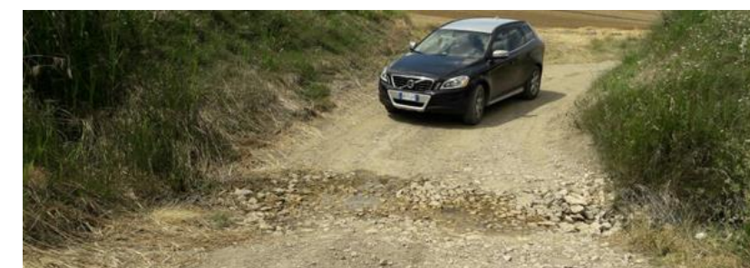
Figura 6 – Attraversamento cavidotto esterno su "Fosso Traversa -Pozzo Pasciucio" – strada sterrata

Per quanto riguarda l'adeguamento di viabilità esistente che conduce alla torre A1 sono previsti degli interventi di sistemazione della strada coerenti con quanto previsto all'art.46 lettera a9) delle NTA del PPTR, ovvero interventi di manutenzione che non comporteranno opere di impermeabilizzazione né alterazioni permanenti della morfologia dei luoghi e dell'attuale regime idraulico. Per quanto riguarda la strada esistente che permette l'accesso alla torre A1, è previsto l'adeguamento temporaneo dell'imbocco dalla SP110. Data la conformazione pianeggiante dell'area, tale intervento verrà eseguito senza alterare la morfologia dei luoghi. Inoltre, anche in tal caso, non verranno eseguiti interventi di impermeabilizzazione.