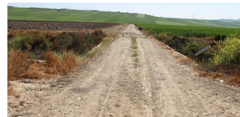
Figura 5 – Attraversamento cavidotto esterno su "Torrente Carapellotto e Vallone Meridiano" – strada sterrata

Si riportano a seguire le foto degli attraversamenti sui corsi d'acqua pubblica.