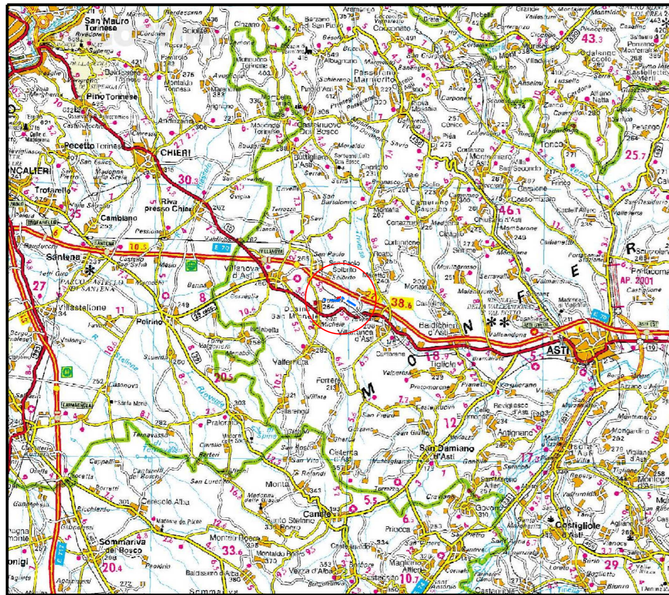
COROGRAFIA Scala 1:250.000

Il presente disegno è di proprietà aziendale - La Società tutela i propri diritti a termine di legge.