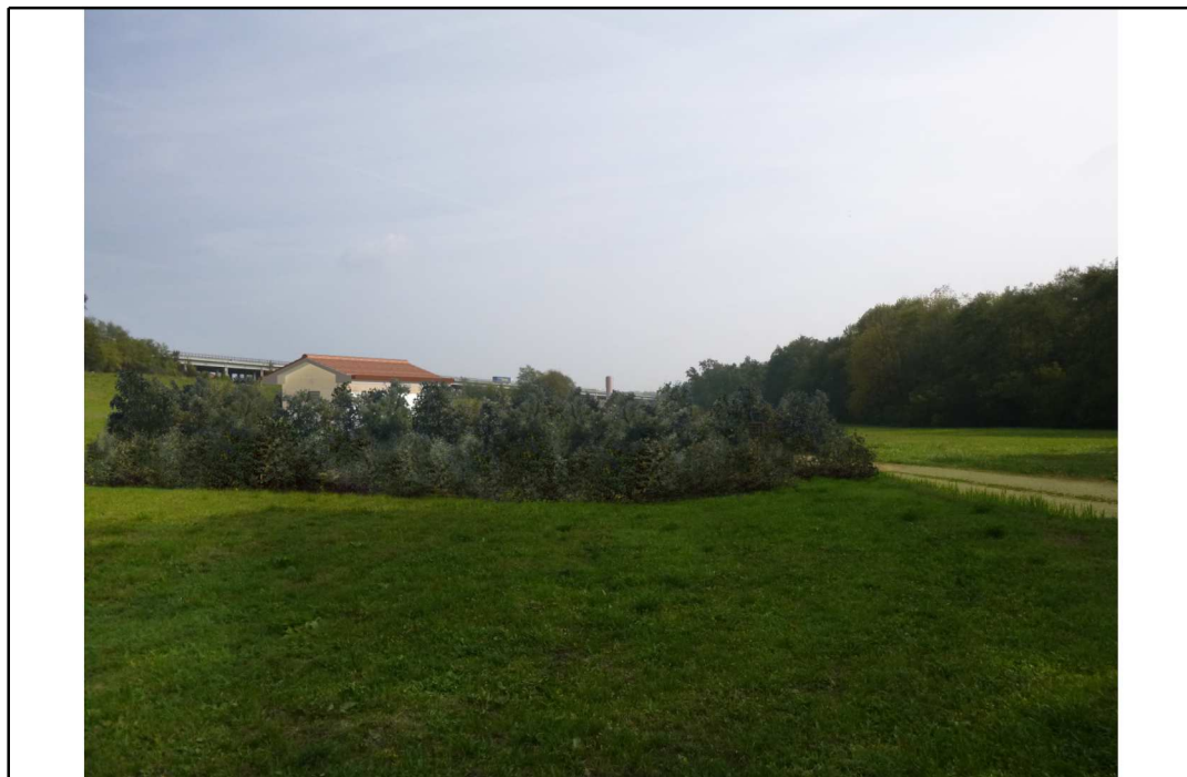
VISTA 3: STATO DI PROGETTO CON MASCHERAMENTO