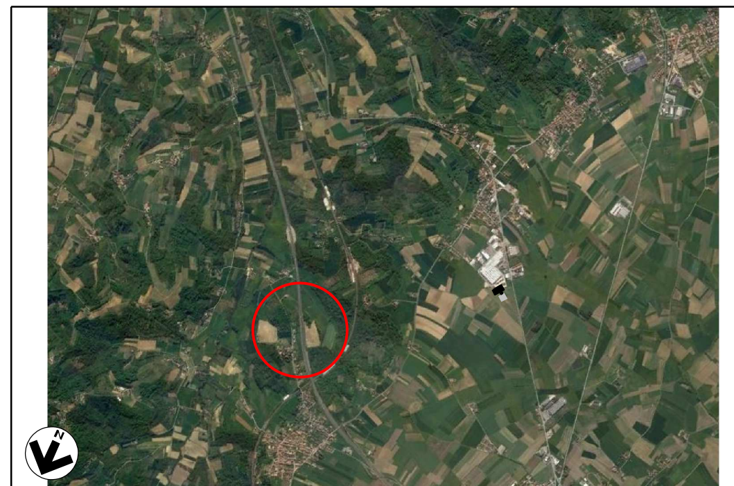
VISTA 4: FOTO AEREA CON EVIDENZIATA L'AREA DI INTERVENTO