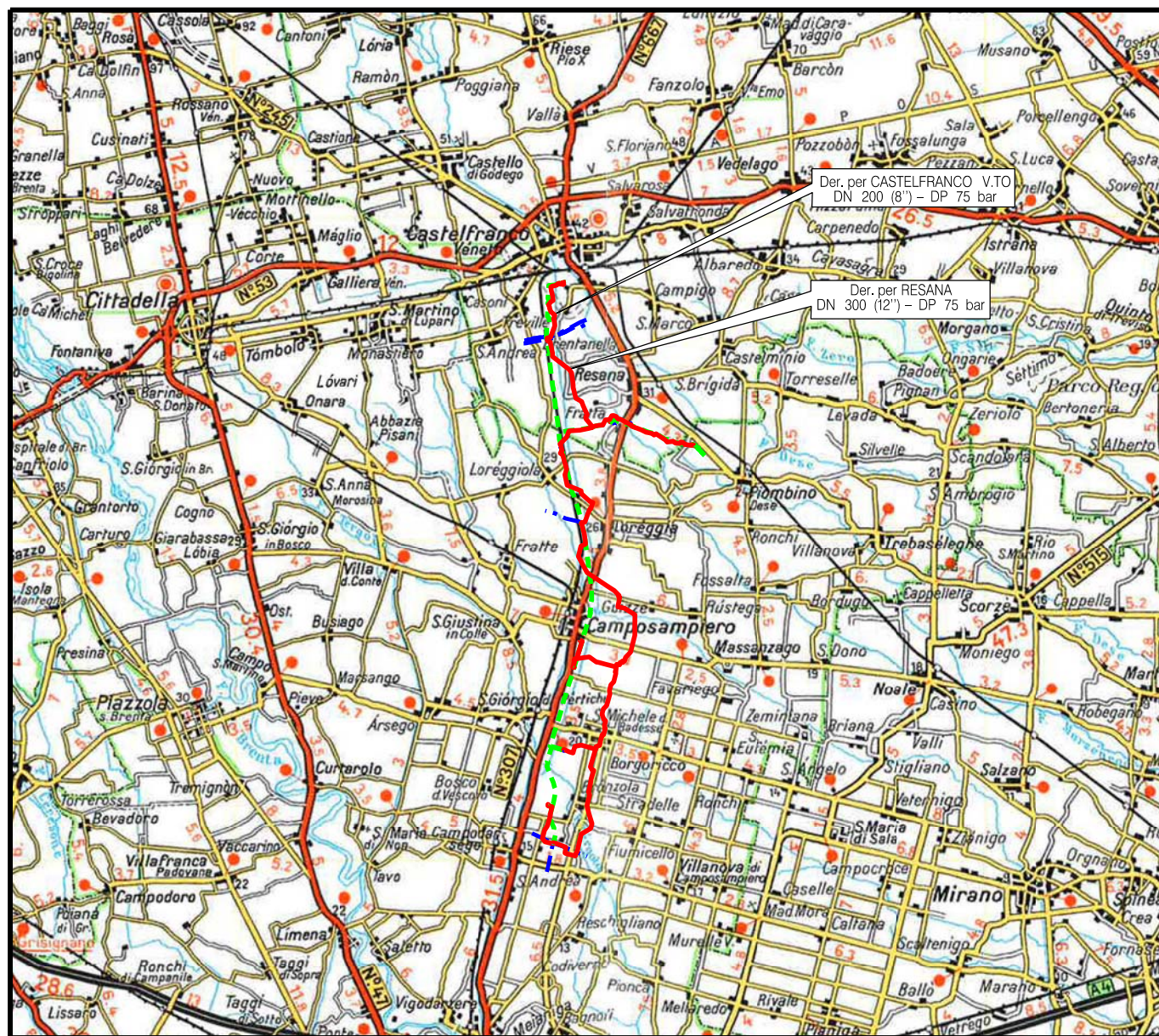
COROGRAFIA Scala 1:200.000

Il presente disegno è di proprietà aziendale - La Società tutelera i propri diritti a termine di legge.