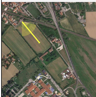
Vista da Strada degli Alidosio