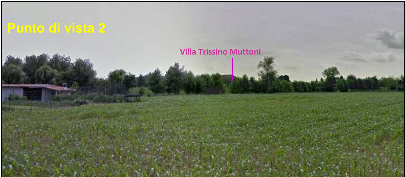
Figura 11 Visuale, limitata dalla vegetazione, di Villa Trissino Muttoni da Strada dei pizzolati, posta ad ovest della villa ed interessata dalla realizzazione della rotatoria dei Pizzolati

Da Strada della Ca'impenta, adiacente Villa Trissino Muttoni, la visuale della villa risulta essere ravvicinata e diretta, ma tale via, oltre a non essere interessata dall'intervento, risulta anche avere un basso livello di frequentazione, trattandosi di una strada al solo servizio di entrata per i due edifici residenziali e di servizi presenti.