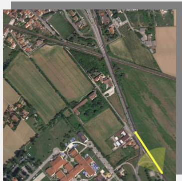
Vista dalla Via Camisano