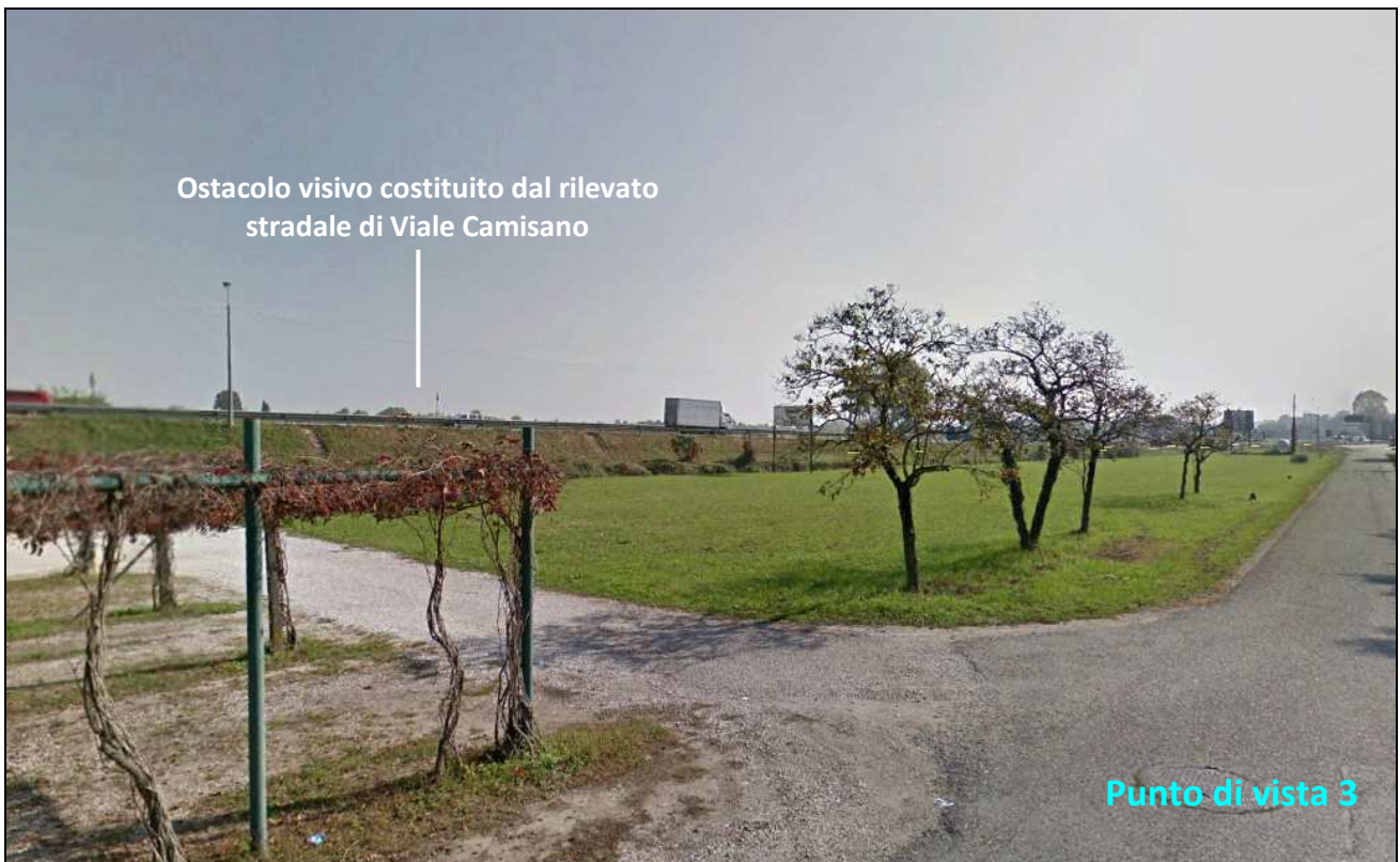
Figura -7 Visuale da Strada della Caimpante limitrofa alla villa, in direzione delle aree di cantiere.

Non essendo Villa Trissino Muttoni visitabile, e per tanto non fruibile, il rapporto visuale che si ha dalla villa verso le aree di cantiere, lo si può considerare solo dalla Strada delle Ca'impenta; da questa viabilità secondaria, come si evince dalla seguente Figura, le aree di cantiere non risultano visibili a causa del rilevato stradale di Viale Camisano, oggetto di intervento, che ostacola la visuale del campo agricolo che verrà occupato, in modo temporaneo, per la realizzazione dei cantieri.