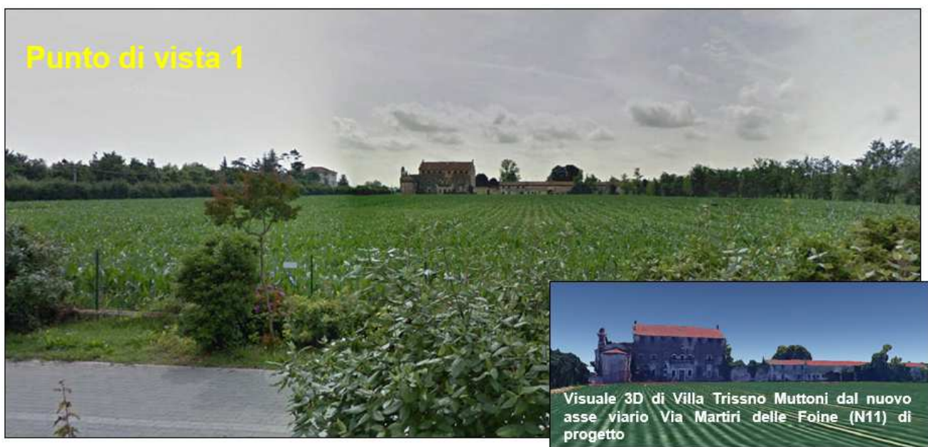
Figura 10 Visuale ampia e diretta di Villa Trissino Muttoni da Strada degli Alidosio, posta a nord della villa ed anteposta al nuovo asse Viario Via Martiri delle Foibe (NV11)

Da Strada degli Alidosio, posta a nord di Villa Trissino Muttoni ed anteposta all'intervento NV11, sia ha una visuale della villa distante, ma ampia ed aperta grazie all'assenza di ostacoli visivi. Dal nuovo asse viario Via Martiri delle Foibe la visuale risulterà più ravvicinata e quindi maggiormente diretta; per tale condizione si è ritenuto necessario realizzare una fotosimulazione, al fine di verificare il rapporto tra lo stato ante operam e quello post operam.