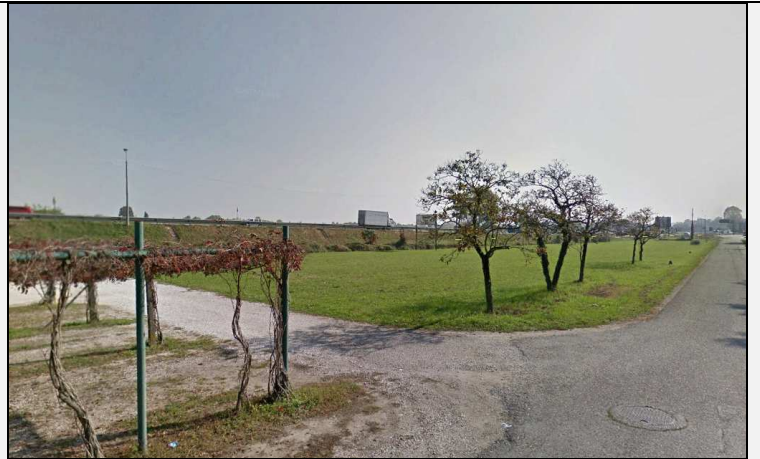
Figura -14 Visuale da Strada della Caimpante limitrofa alla villa, in direzione, in fase ante operam, delle area di cantiere, e in fase post operam dell'intervento N12 e del tratto del nuovo filobus.