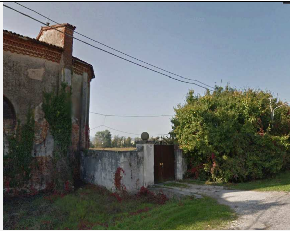
Figura -13 Scorcio visuale da Strada della Caimpante limitrofa alla villa, in direzione dell'intervento NV11

Non essendo Villa Trissino Muttoni visitabile, e per tanto non fruibile, il rapporto visuale che si ha dalla villa verso gli interventi, lo si può considerare solo dalla Strada delle Caimpante, dalla quale, come si evince dalla Figura -13 l'intervento NV12 non risulta visibile a causa della presenza del muro di pertinenza della villa, che ne ostacola la visuale. Mentre (cfr. Figura -14) è visibile l'intervento effettuato su Viale Camisano (NV11), il quale però, per tale tratto di strada, non apporta modifiche sostanziale, almeno da tale visuale, rispetto allo stato attuale.