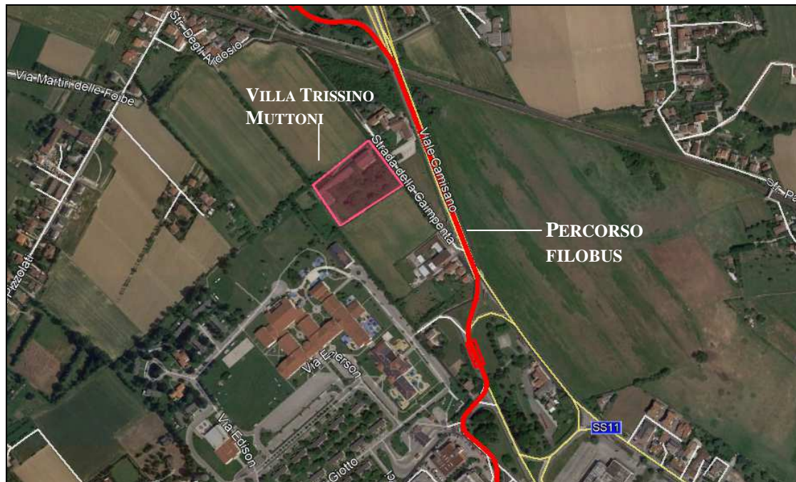
Figura -3 Planimetria del percorso del filobus lungo Viale Camisano, in prossimità della Villa Trissino Muttoni

In coerenza con la raccomandazione 14 della Relazione sulla Missione consultiva ICOMOS/UNESCO per la città di Vicenza e Ville Palladio nel Veneto , si valuta il rapporto visuale tra Villa Trissino Muttoni e l'intervento sopra descritto.