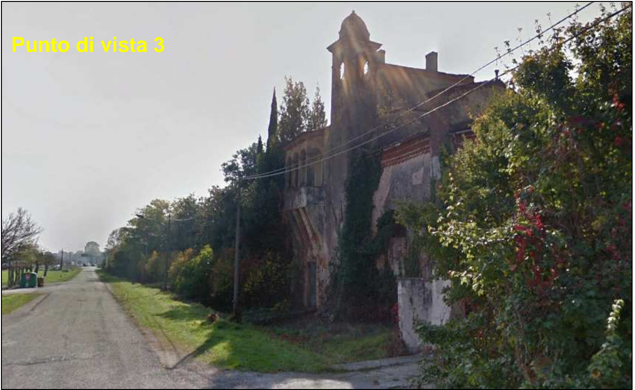
Figura Errore. Nel documento non esiste testo dello stile specificato.-12 Visuale ravvicinata e diretta di Villa Trissino Muttoni da Strada della Caimpenta, ad ovest della villa