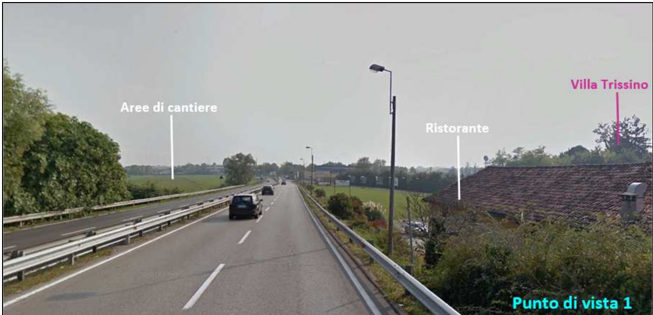
Figura-5 Vista da nord lungo Viale Camisano: rapporto aree di cantiere e Villa Trissino

Una condizione percettiva in cui si verificano relazioni visuali tra la Villa Trissino e le aree di cantiere si presenta, invece, per un breve tratto percorrendo Viale Camisano in direzione da sud verso nord. Come si evince dalla Figura -6Figura-5Figura -6, la percezione della Villa è distante e di tipo frammentato, in quanto ostacolata dealla presenza di elementi stradali (cartellonistica, pali della lune, etc.); per tale condizione si è ritenuto necessario realizzare una fotosimulazione, al fine di verificare il rapporto tra lo stato ante operam e lo stato in fase di cantiere.