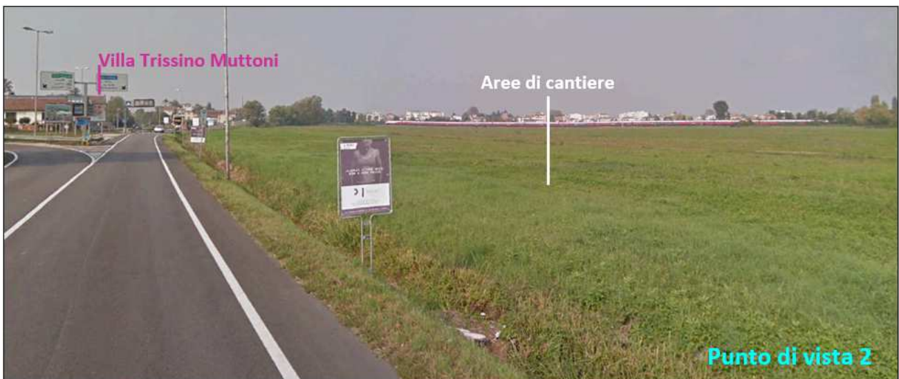
Figura -6 Visuale lontana e limitata della Villa Trissino Muttoni e della aree di cantiere da Viale Camisano.

Una condizione percettiva in cui si verificano relazioni visuali tra la Villa Trissino e le aree di cantiere si presenta, invece, per un breve tratto percorrendo Viale Camisano in direzione da sud verso nord. Come si evince dalla Figura -6Figura-5Figura -6, la percezione della Villa è distante e di tipo frammentato, in quanto ostacolata dealla presenza di elementi stradali (cartellonistica, pali della lune, etc.); per tale condizione si è ritenuto necessario realizzare una fotosimulazione, al fine di verificare il rapporto tra lo stato ante operam e lo stato in fase di cantiere.