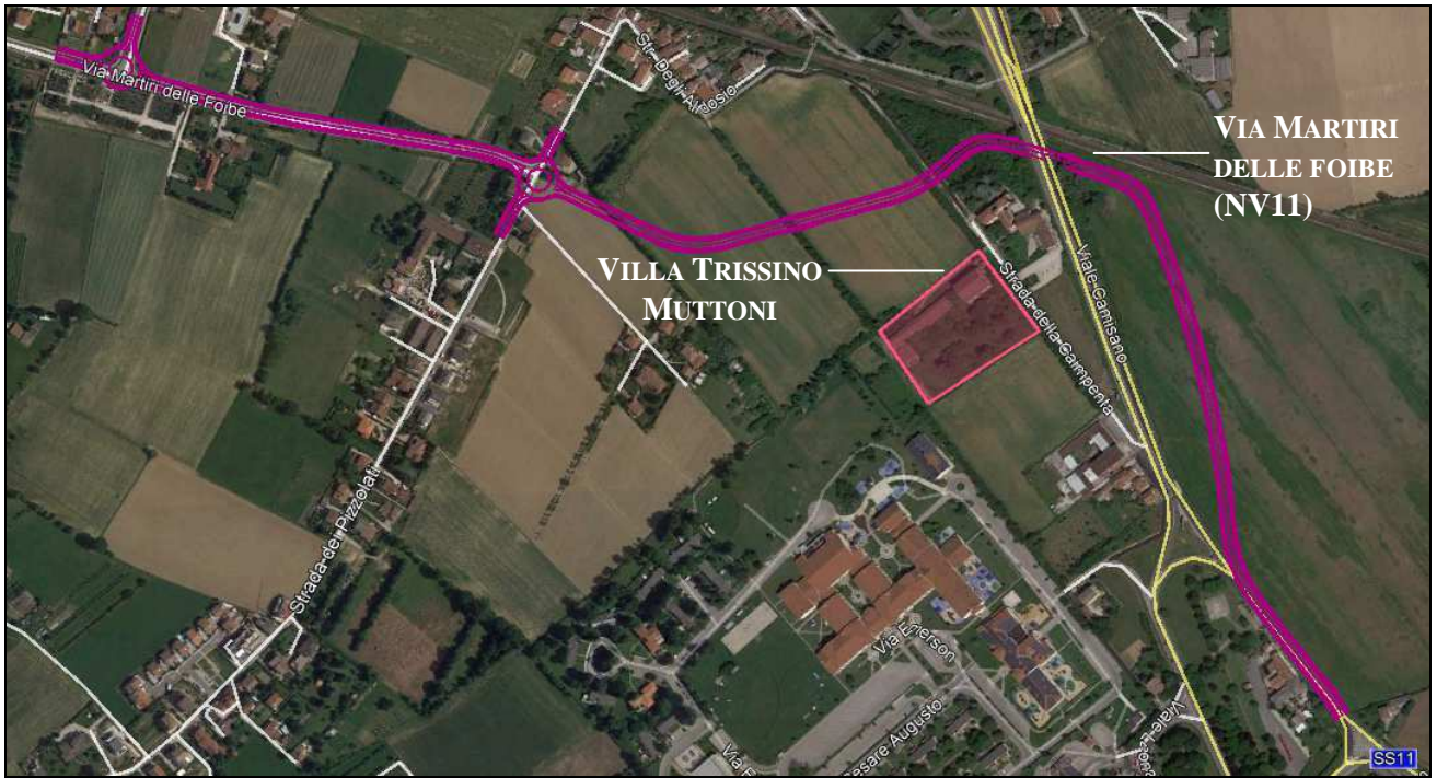
Figura-1 Planimetria del nuovo asse Viario Via Martiri delle Foibe (NV11), in prossimità della Villa Trissino Muttoni