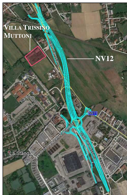
Figura -2 Planimetria del nuovo asse viario Viale Camisano - Viale Serenissima (NV12), in prossimità della Villa Trissino Mutton

Il nuovo Asse Viario Viale Camisano - Viale Serenissima (NV12), contestualmente al rifacimento dell'opera di scavalco dei binari ferroviari, prevede la realizzazione di una direttrice nord-sud costituita da un asse stradale continuo dato dalla successione di Viale Camisano e Viale Serenissima dedicata al traffico passante e prevedendo, sfalsata rispetto alla precedente, una nuova viabilità destinata al traffico locale, regolata dalla presenza di diverse rotonde; le due viabilità saranno connesse mediante l'ausilio di 4 rampe unidirezionali di nuova realizzazione (due di uscita e due di entrata), collegate ad una grande rotonda ubicata sotto il nuovo "Cavalcavia della Serenissima".