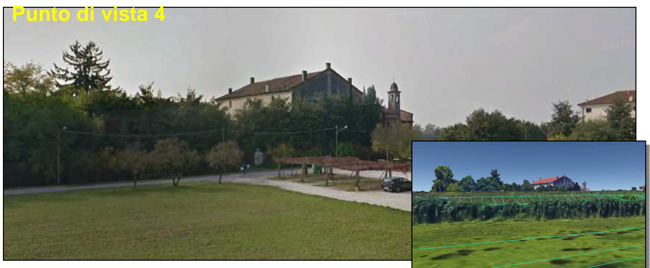
Figura -9 Visuale, limitata dalla presenza della vegetazione, da Viale Camisano, ad ovest della villa ed interessato dal nuovo Asse Viario Viale Camisano - Viale Serenissima (NV12), che dal passaggio della filobus

L'intervento NV12 prevede anche la realizzazione di una nuova direttrice, posta ad est rispetto a Viale Camisano, lungo la quale la visuale verso la villa risulterà "allontanata" rispetto al percorso attuale, come riportato nella Figura -9