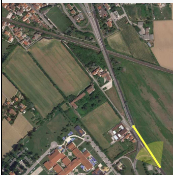
Vista da Via Camisano