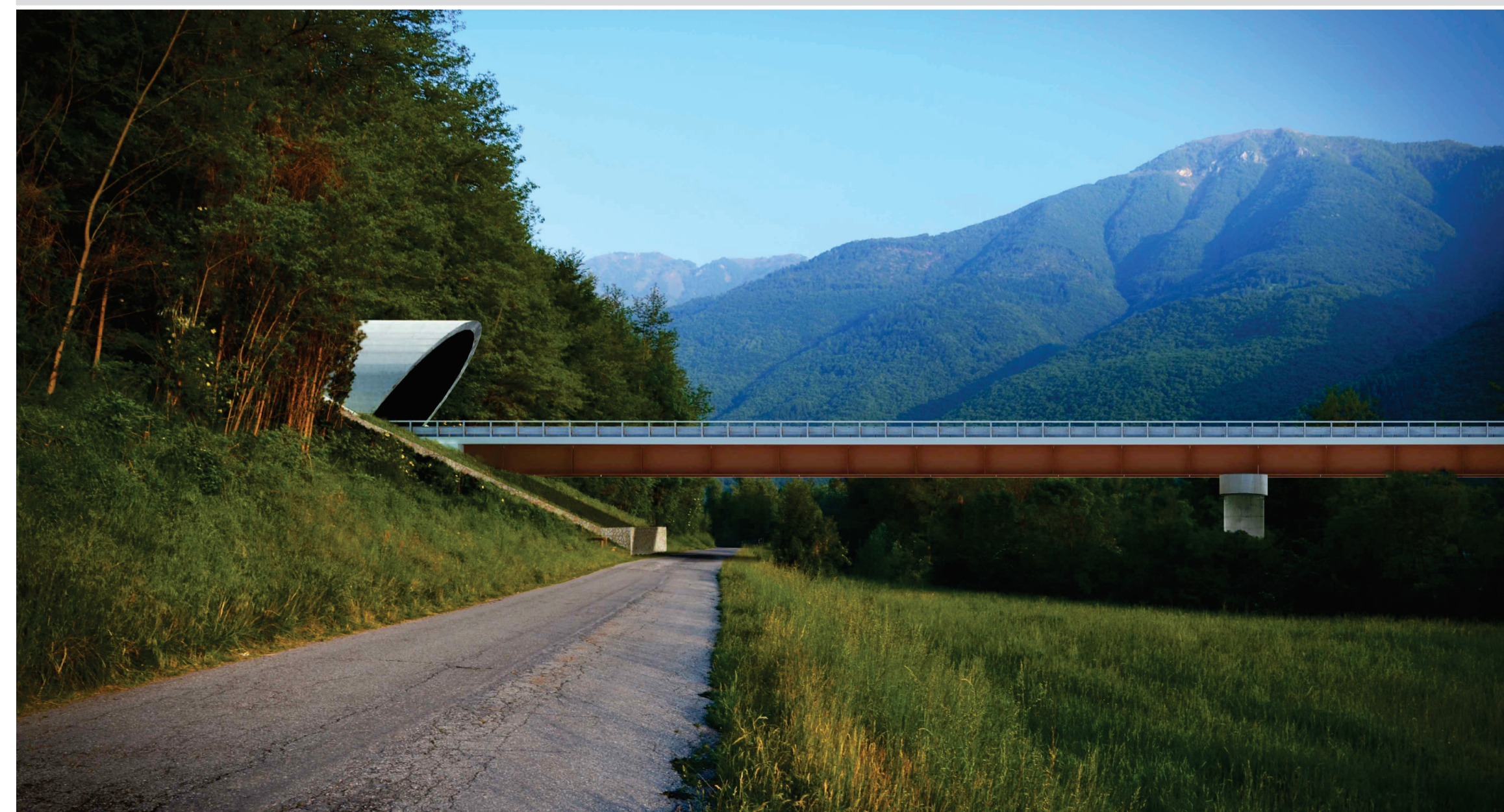
FOTOSIMULAZIONE 4 - ROTATORIA EST E IMBOCCO EST GALLERIA DEMONTE