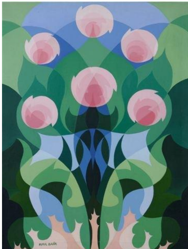
Giacomo Balla (1871-1958) Balfiore: Rose, 1927