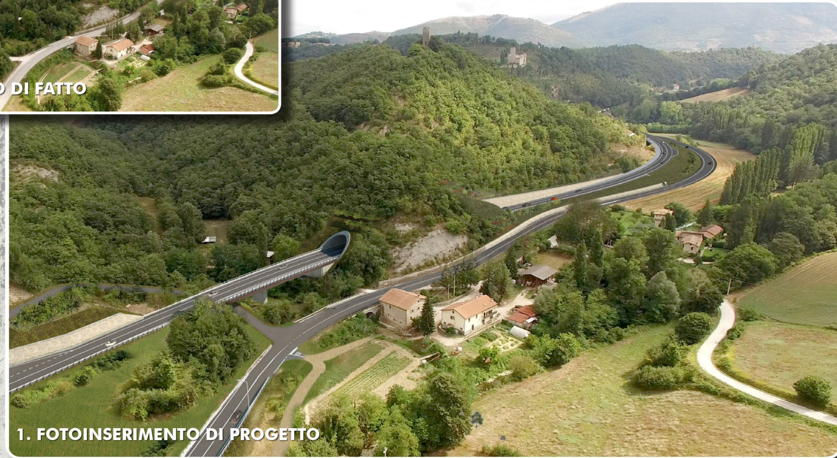
1. FOTOINSERIMENTO DI PROGETTO