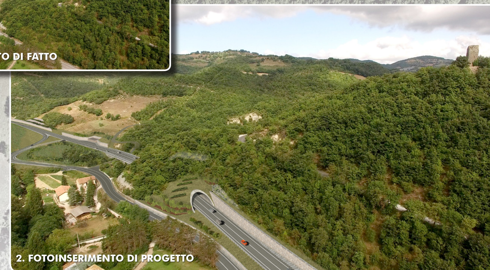
2. FOTOINSERIMENTO DI PROGETTO