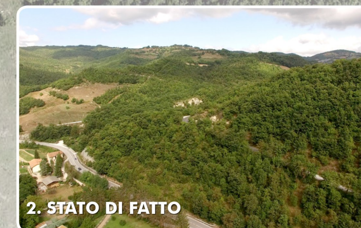
2. STATO DI FATTO