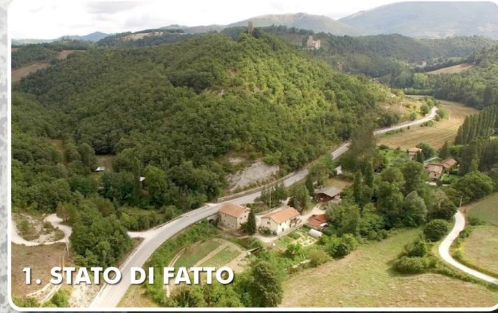
1. STATO DI FATTO