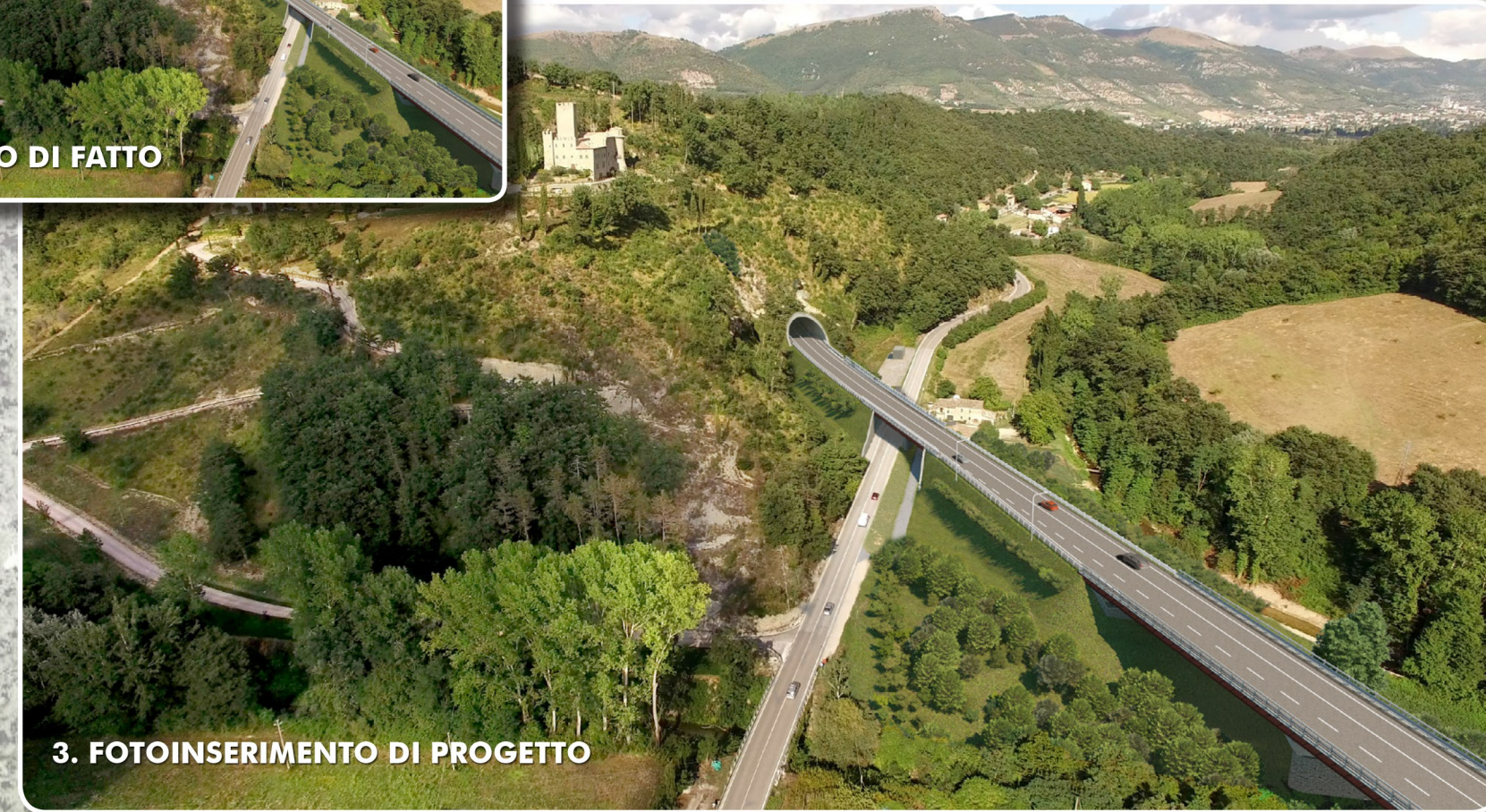
3. FOTOINSERIMENTO DI PROGETTO