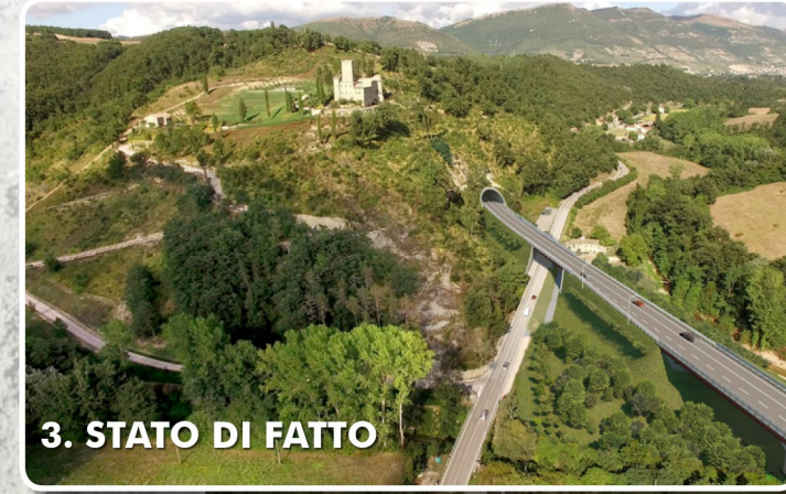
3. STATO DI FATTO