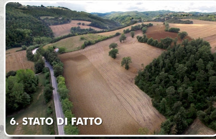
6. STATO DI FATTO