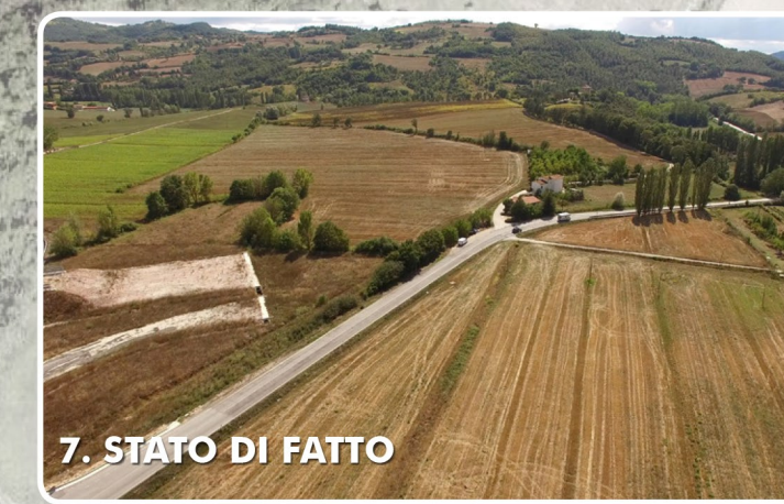
7. STATO DI FATTO