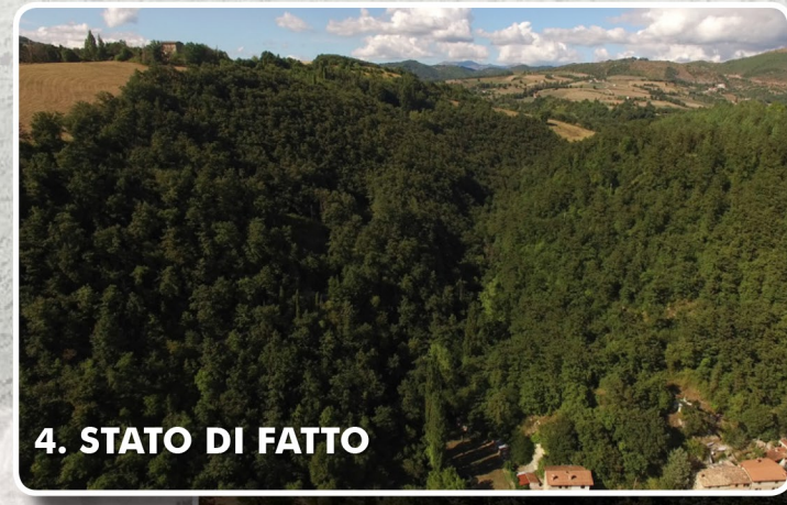
4. STATO DI FATTO