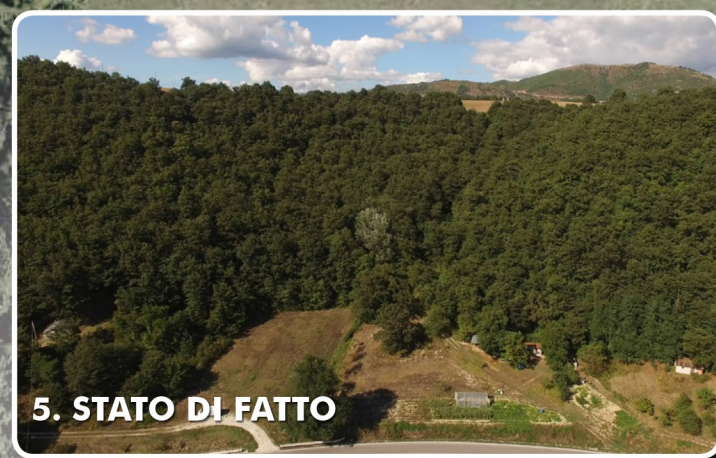
5. STATO DI FATTO