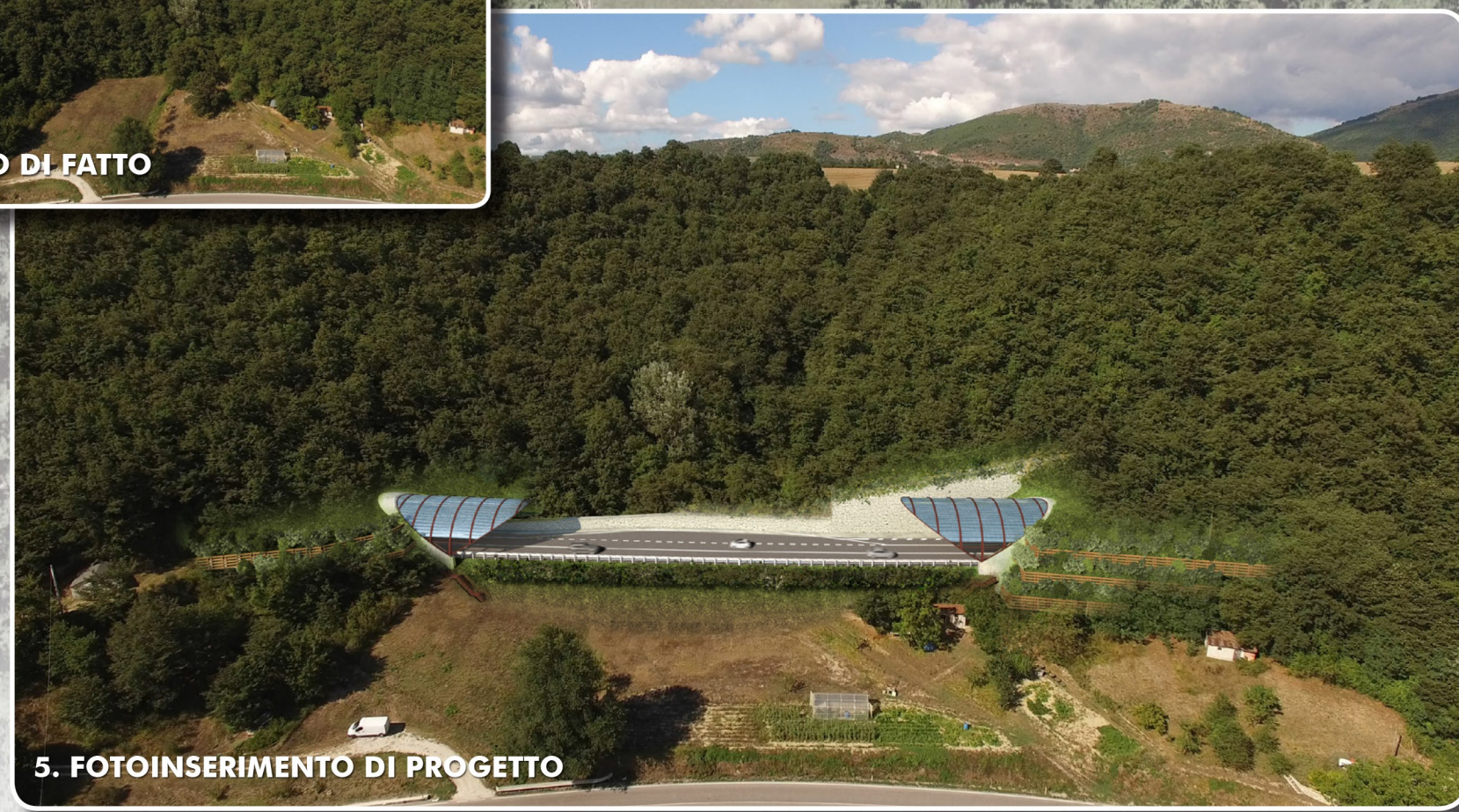
5. FOTOINSERIMENTO DI PROGETTO