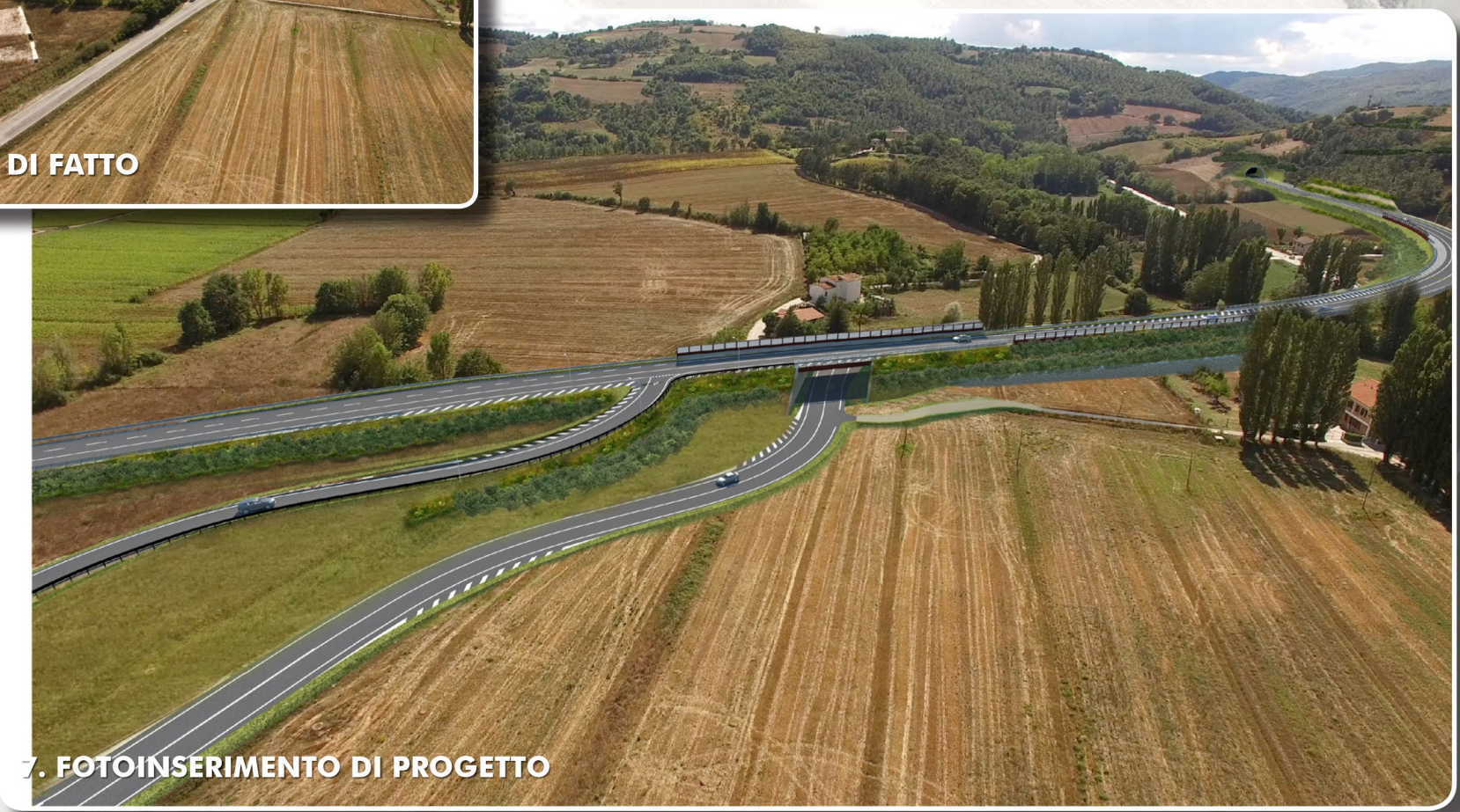
7. FOTOINSERIMENTO DI PROGETTO