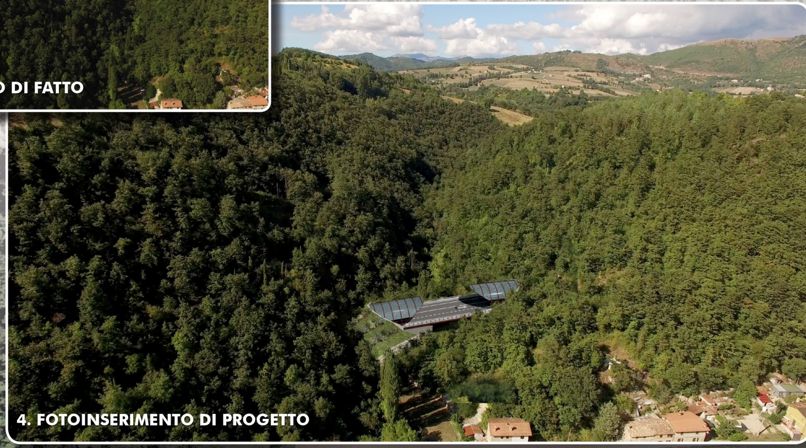
4. FOTOINSERIMENTO DI PROGETTO