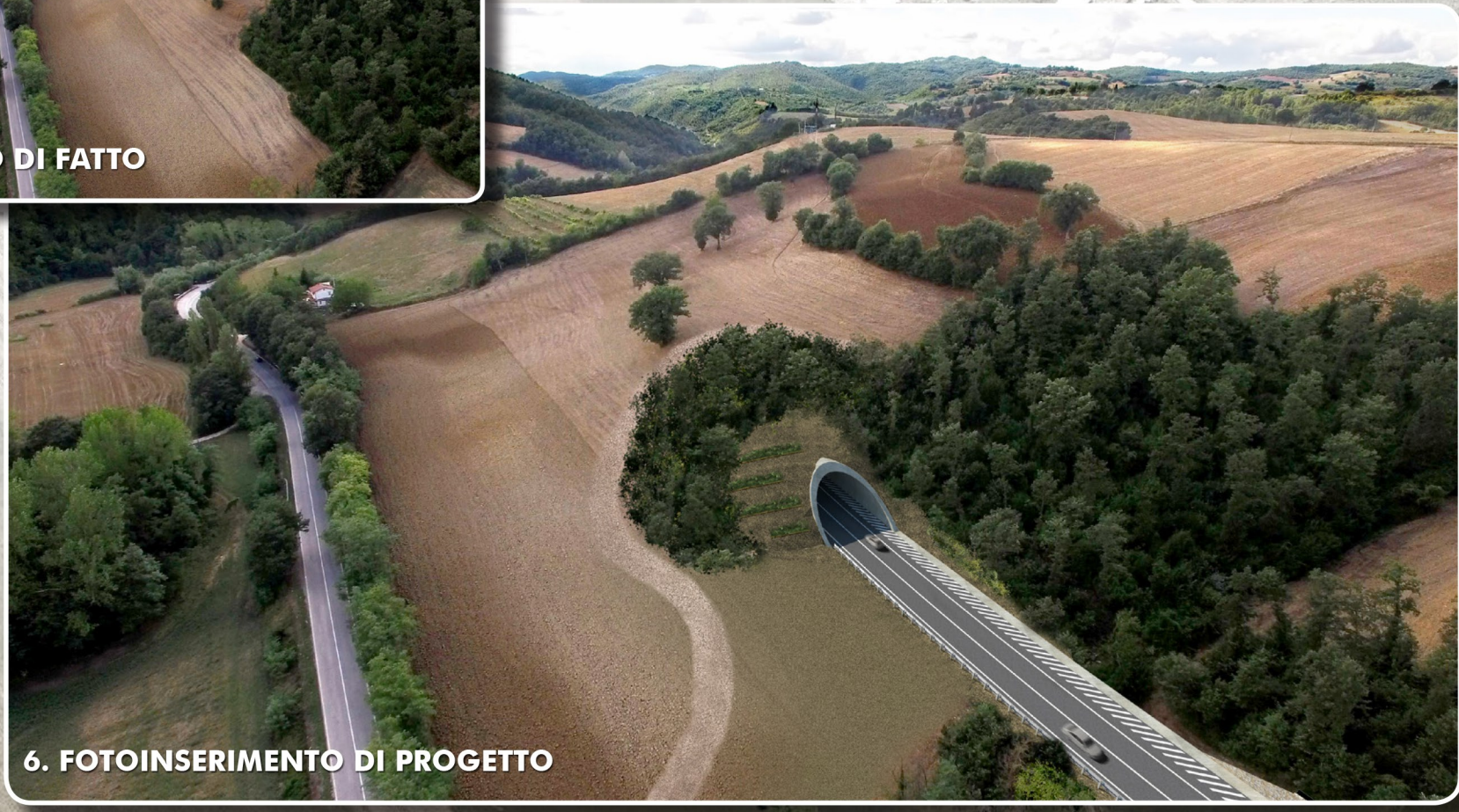
6. FOTOINSERIMENTO DI PROGETTO