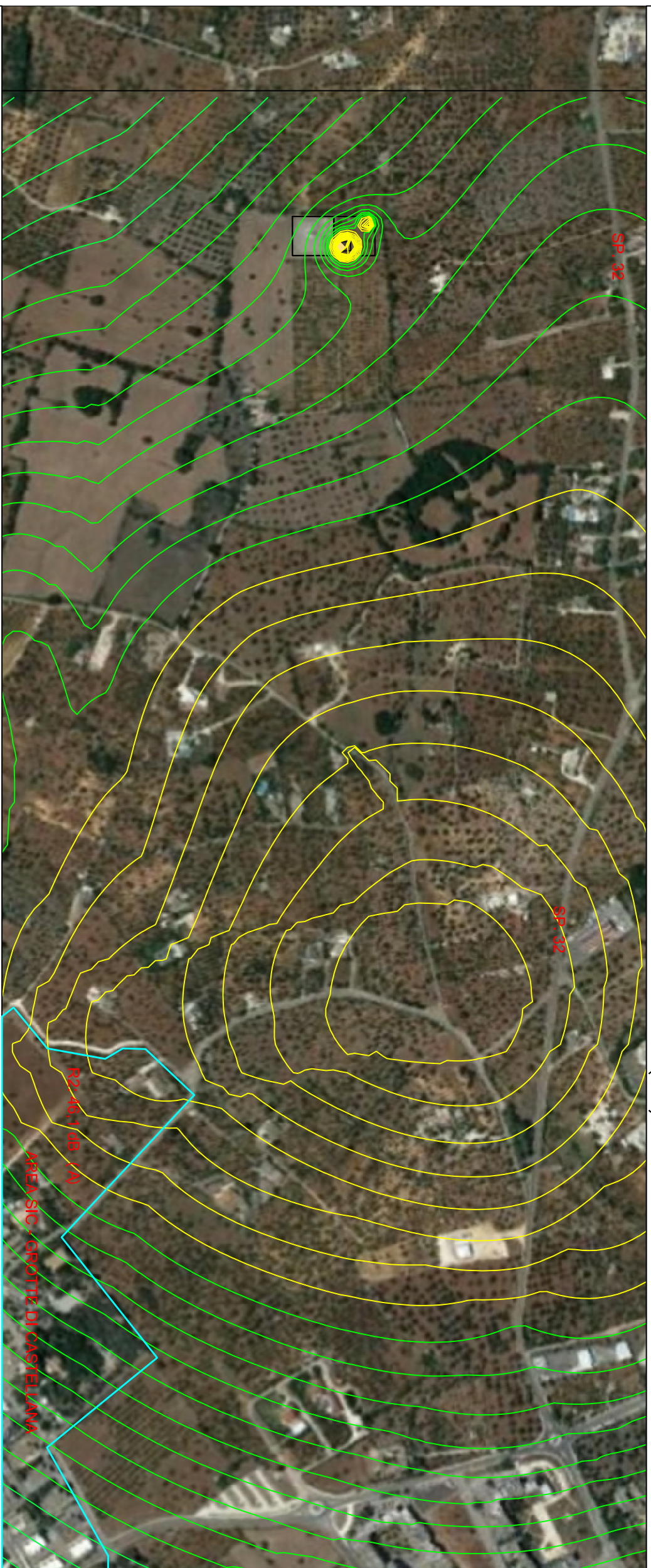
SIMULAZIONE STATO DI PROGETTO CON SISTEMI SCHERMANTI - AREA SIC CASTELLANA GROTTE Scala 1:5000 (22.00 - 06.00 NOTTURNO)