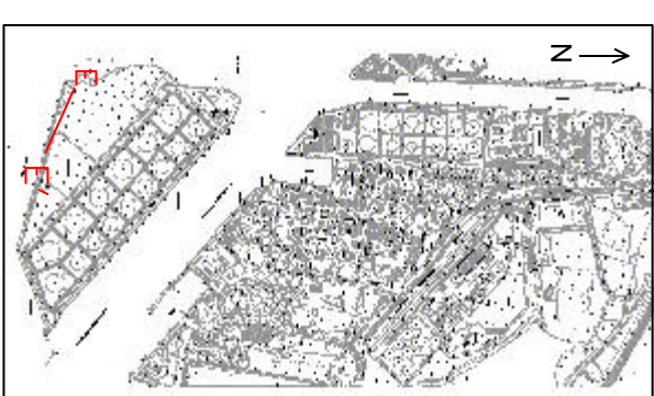
— SEZIONE E - E'