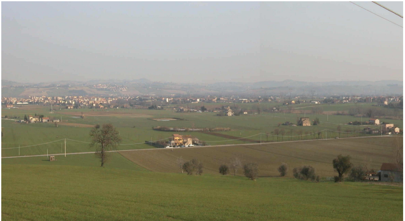
Situazione ANTE OPERAM