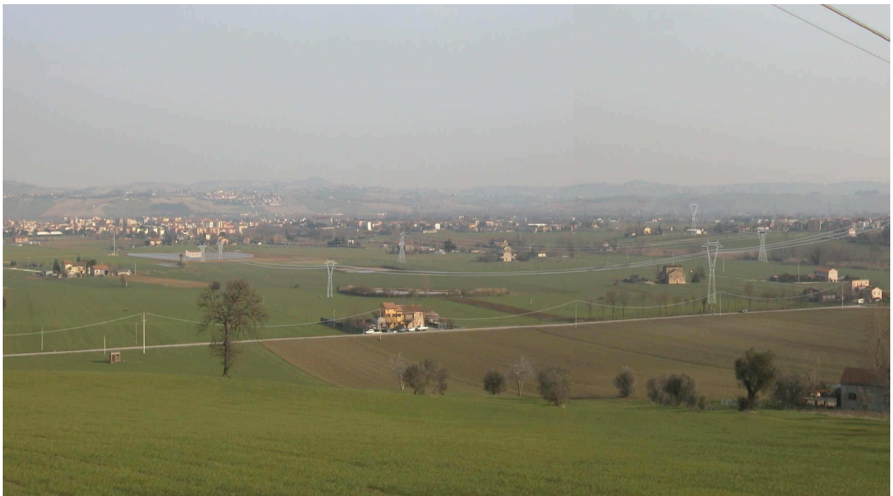
Rappresentazione POST OPERAM