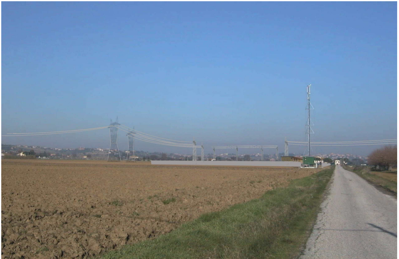
Rappresentazione POST OPERAM