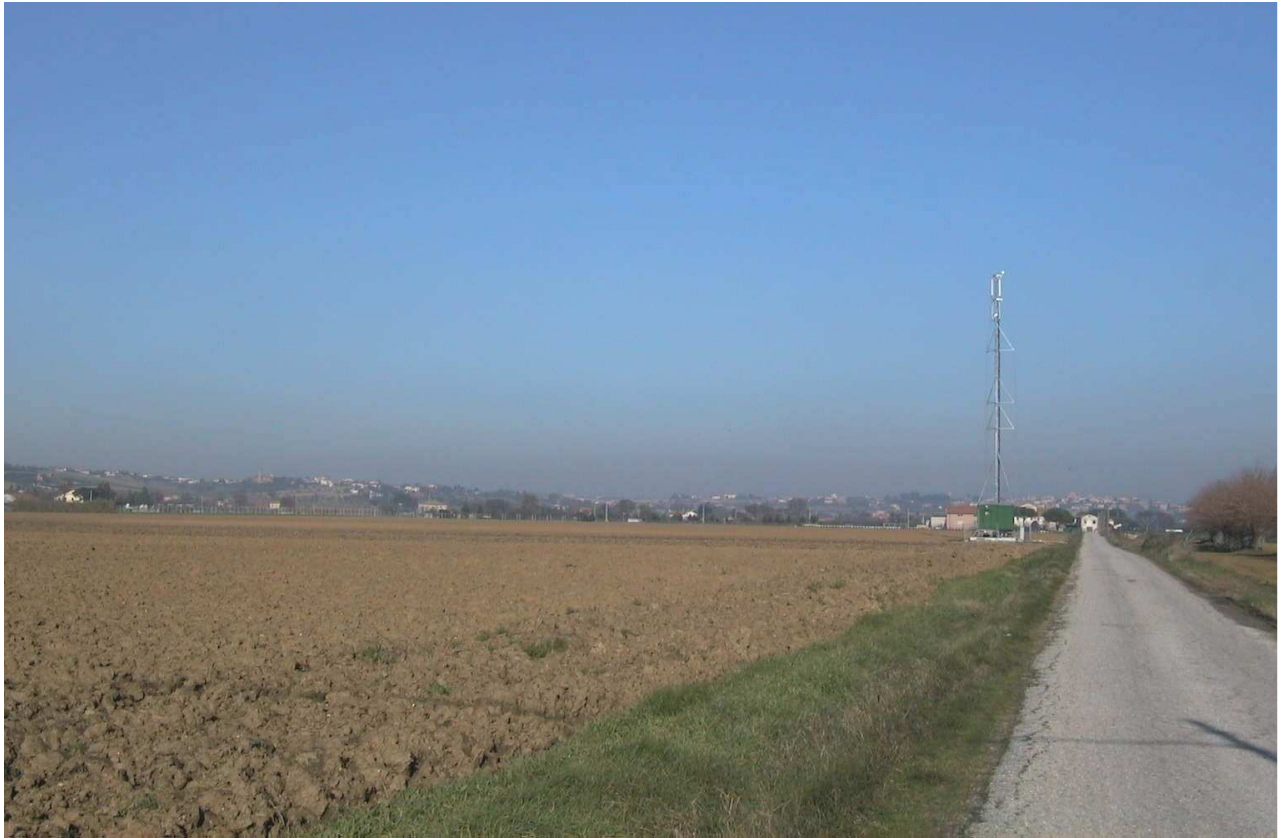
Situazione ANTE OPERAM